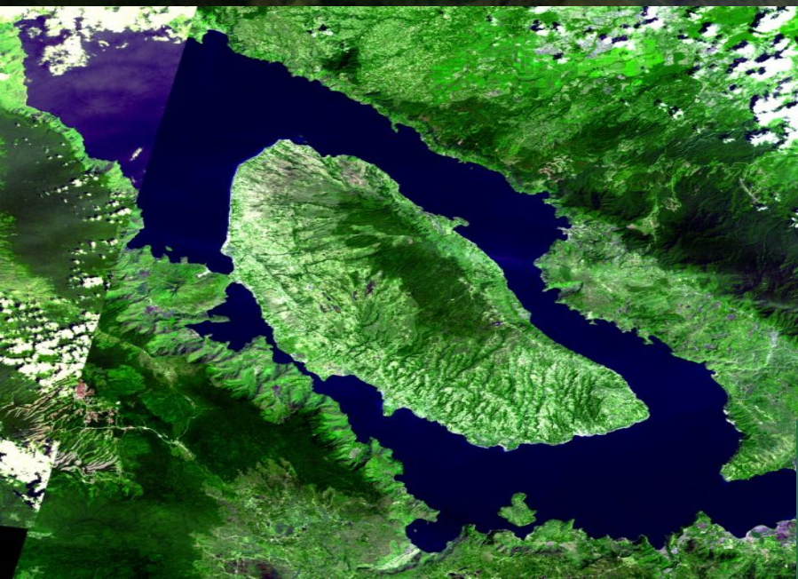
Озеро Тоба, Суматра.