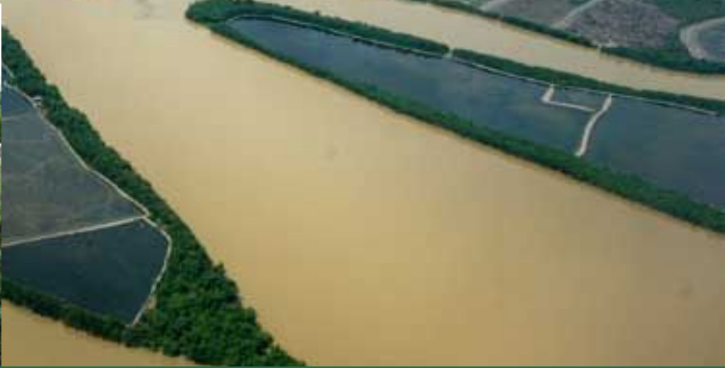
Река Капуас о. Калимантан.