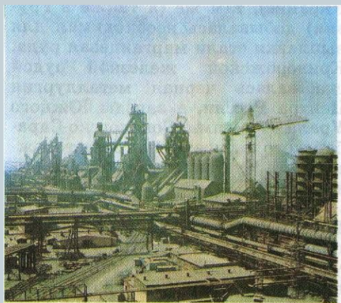
Рис. 37. Доменный цех Магнитогорского металлургического комбината