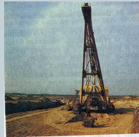
Рис. 30. Открытая добыча угля в Назаровском разрезе (Канско-Ачинский бассейн)