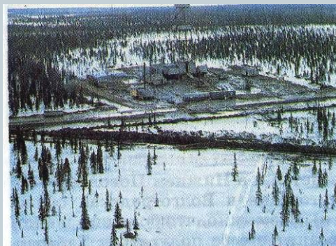
Рис. 28. В погоне за нефтью приходится все дальше продвигаться на Север