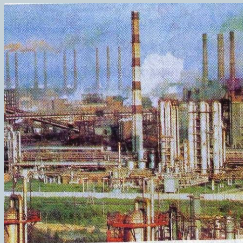
Рис. 36. Металлургический комбинат полного цикла «Северсталь» в Череповце