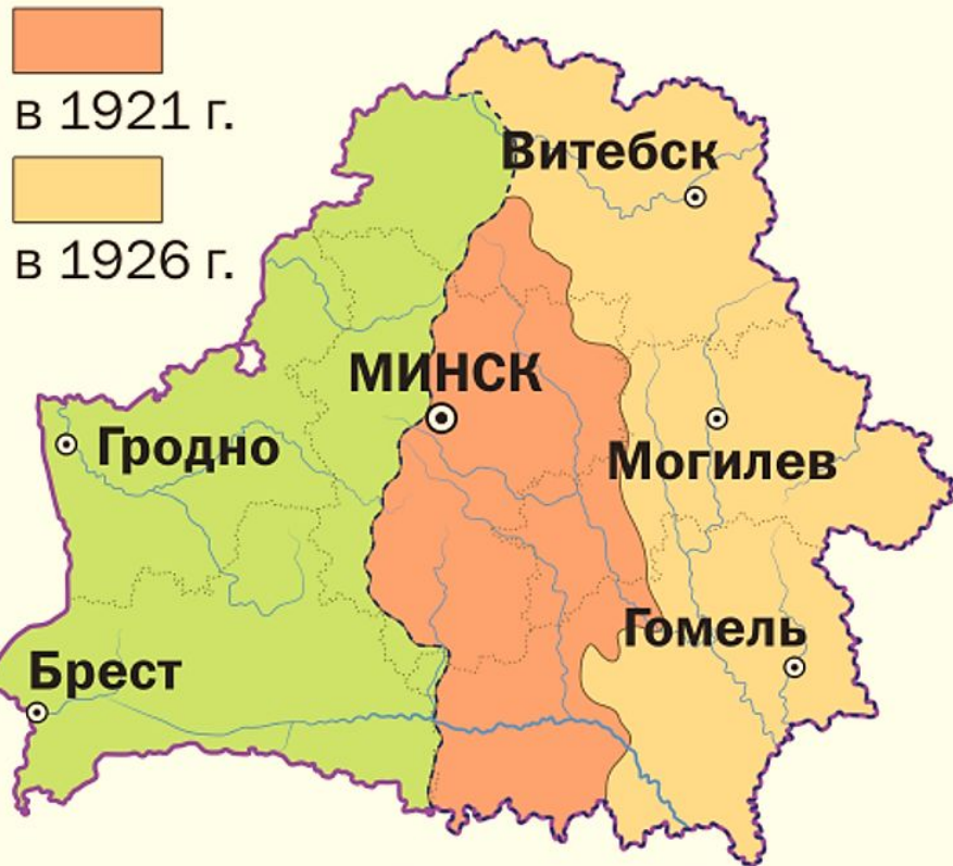
Территория Беларуси в 1920-х гг.

— границы Беларуси в 1921 г. - - - границы Беларуси в 1926 г.