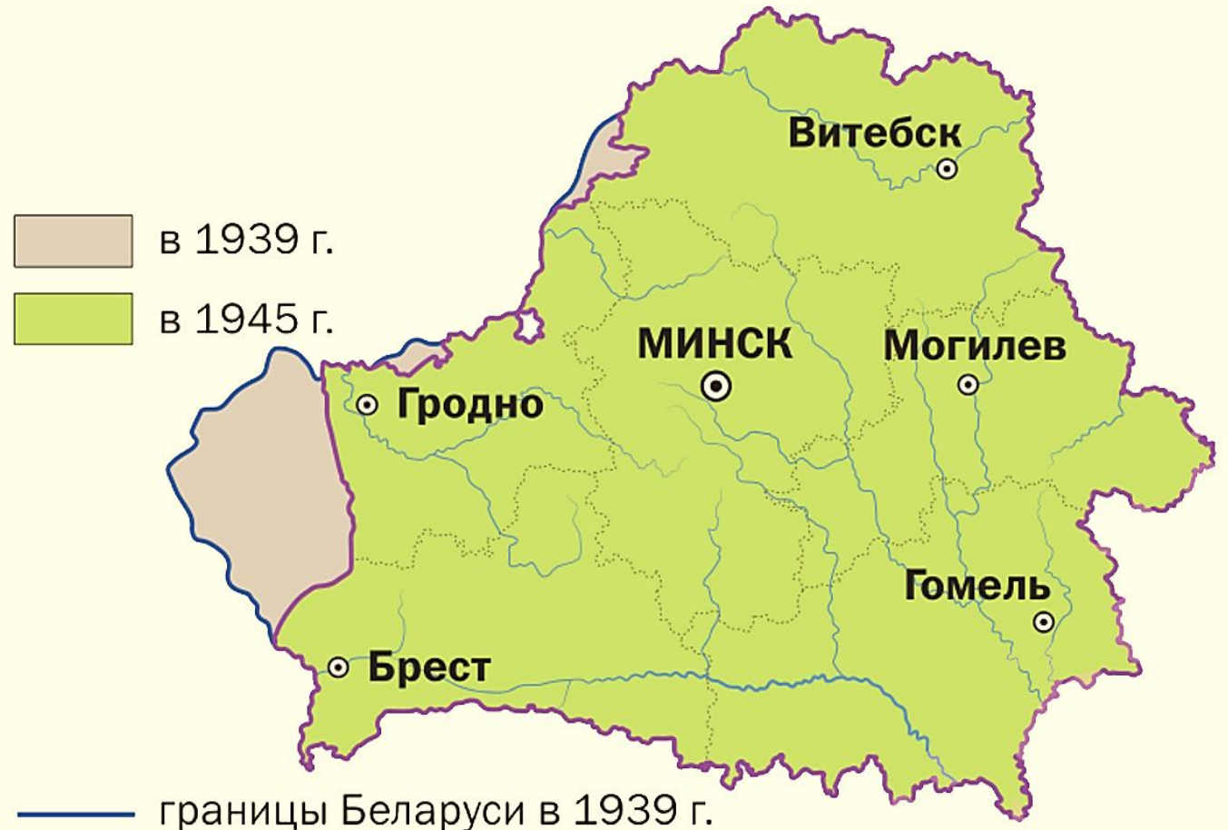
Территория Беларуси в 1930–1940-х гг.

— границы Беларуси в 1921 г. - - - границы Беларуси в 1926 г.