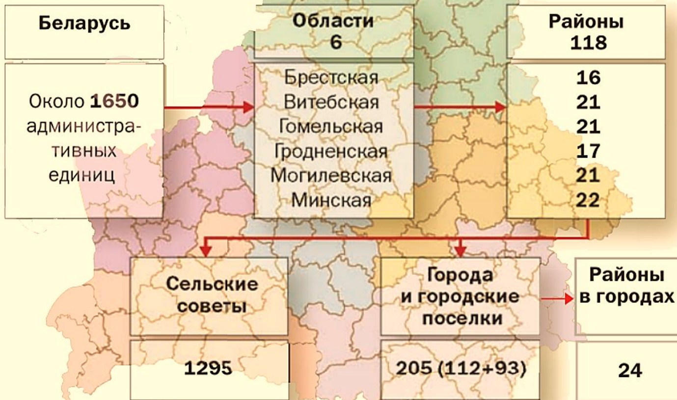
Современное административно-территориальное деление Беларуси на 01.01.2011