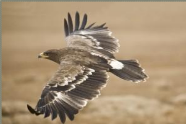
Мухоловка, скопа, поползень, орел