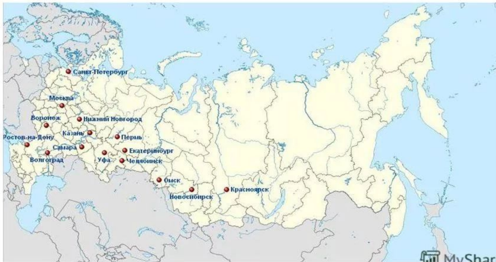
Города-миллионеры России (по состоянию на 2012 год)

Города-миллионеры — категория городов на территории Российской Федерации, численность населения в пределах городской черты которых превышает 1 млн. человек.