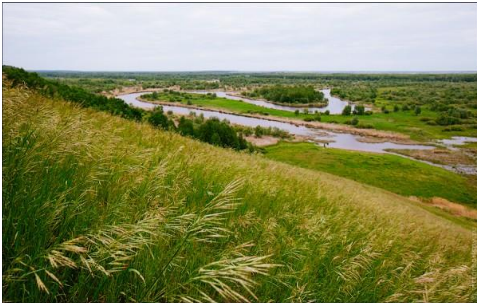
Урёмы – пойменные леса