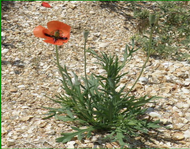
Мак ( коса Долгая)