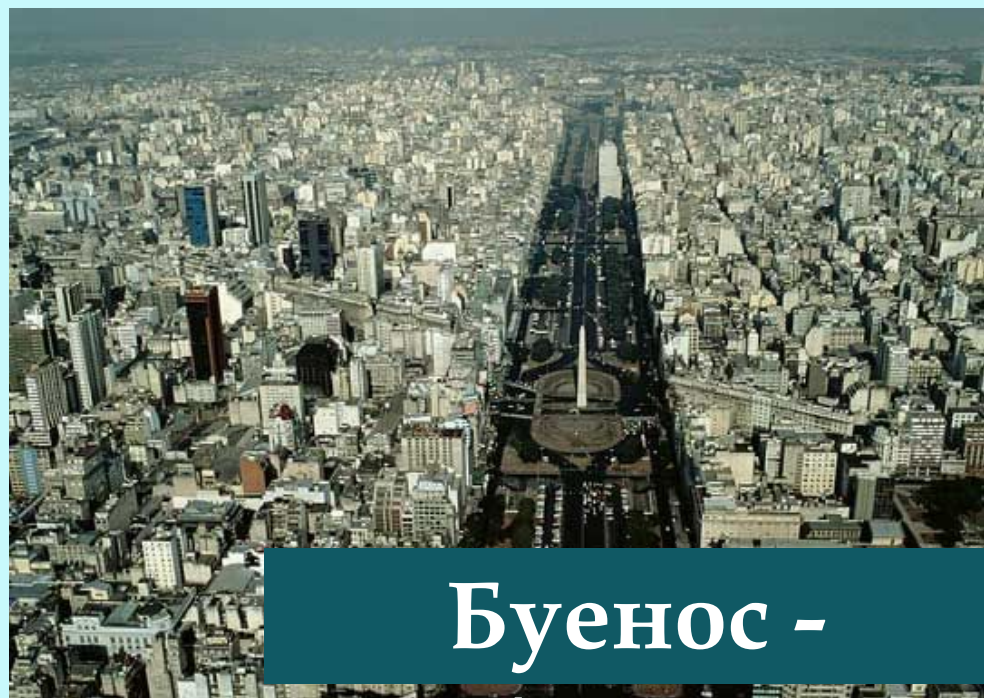
Буенос - Айрес