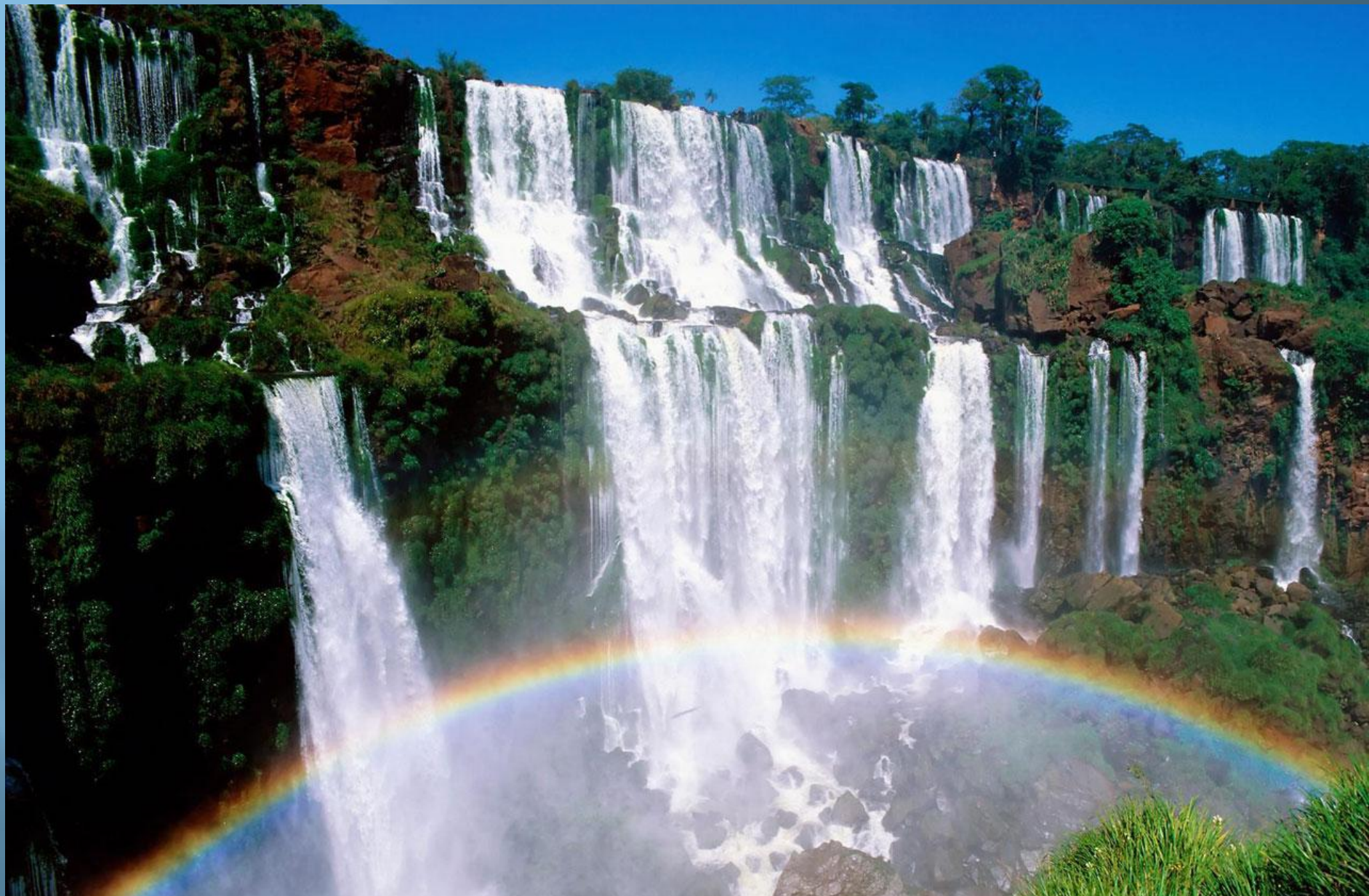
Водоспад Ігуасу (на кордоні Аргентини та Бразилії)