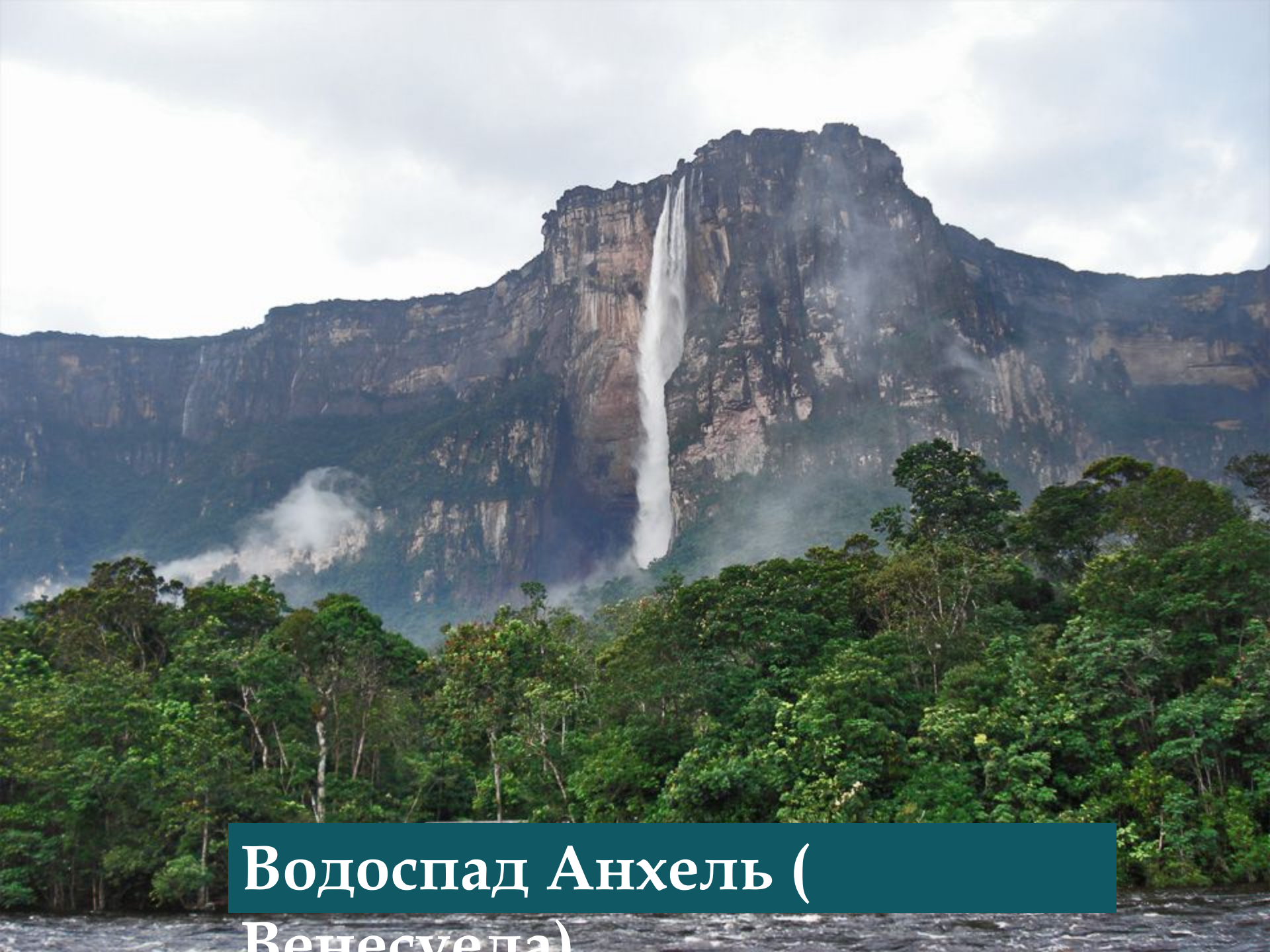
Водоспад Анхель (Венесуела)