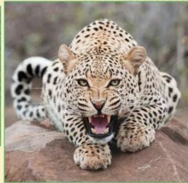
Леопард— хищное животное