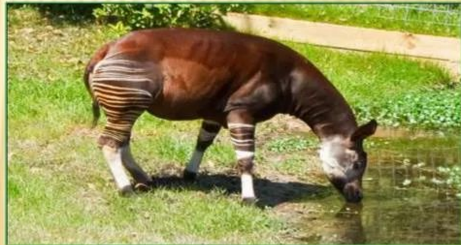
Окапи, обитают только в Африке