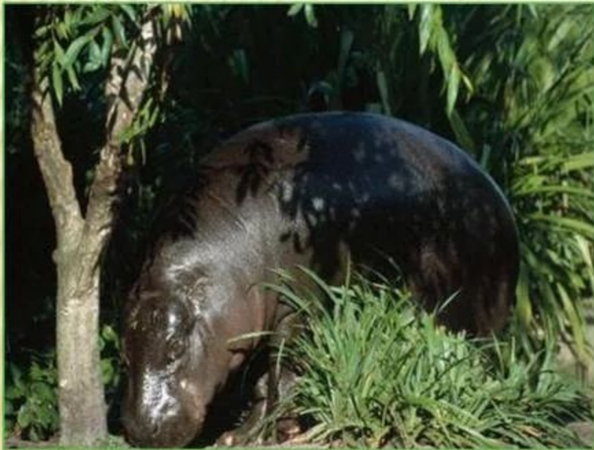
Карликовый бегемот до 80 см.