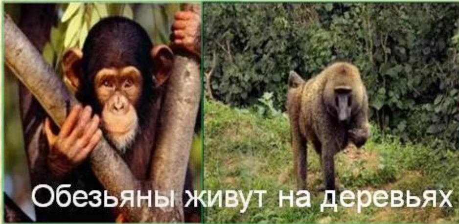
Обезьяны живут на деревьях