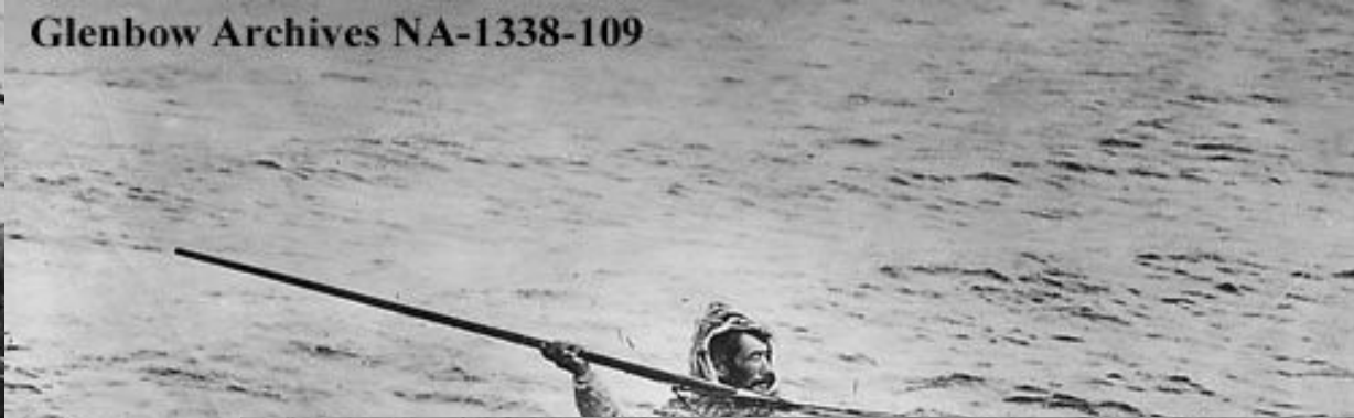
Glenbow Archives NA-1338-109