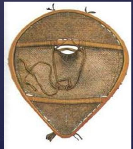
Головной убор охотника