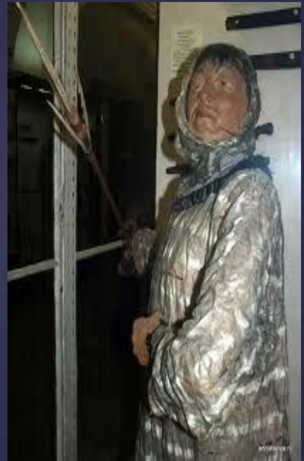
Алеут-охотник в одежде из кишок животного

С древних времен алеуты шили уникальную одежду из шкурок птиц – парки из топорков. На изготовление парки шло 300- 400 шкурок. Шкурки снимали чулком с туловищ топорков, выделявали и сшивали сухожильными нитками.