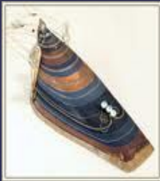
Парки –длинные рубашки алеутов