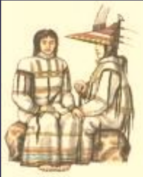
Алеуты в традиционной одежде