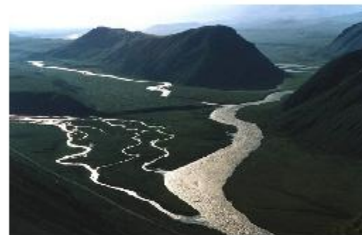
Река с притоками