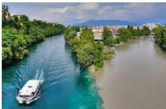
Место слияния двух рек