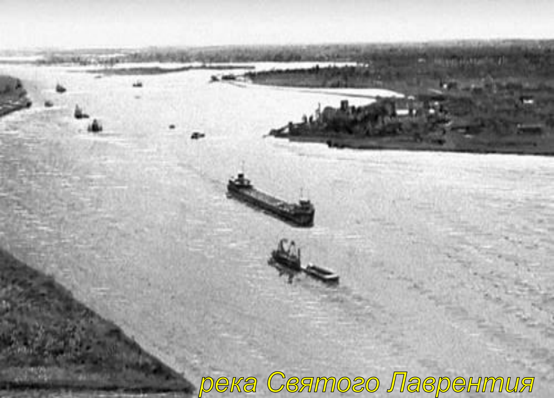
река Святого Лаврентия