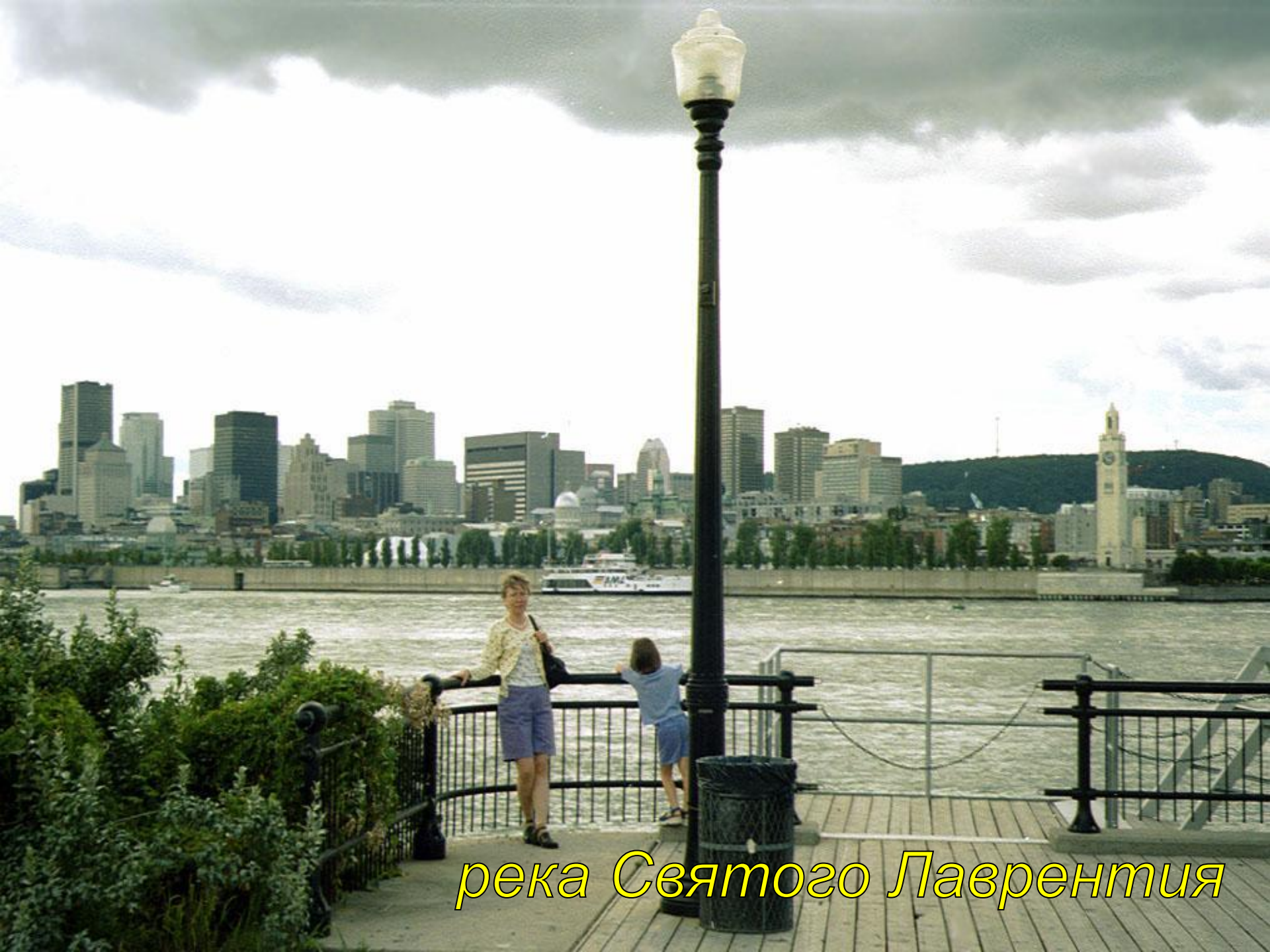
река Святого Лаврентия