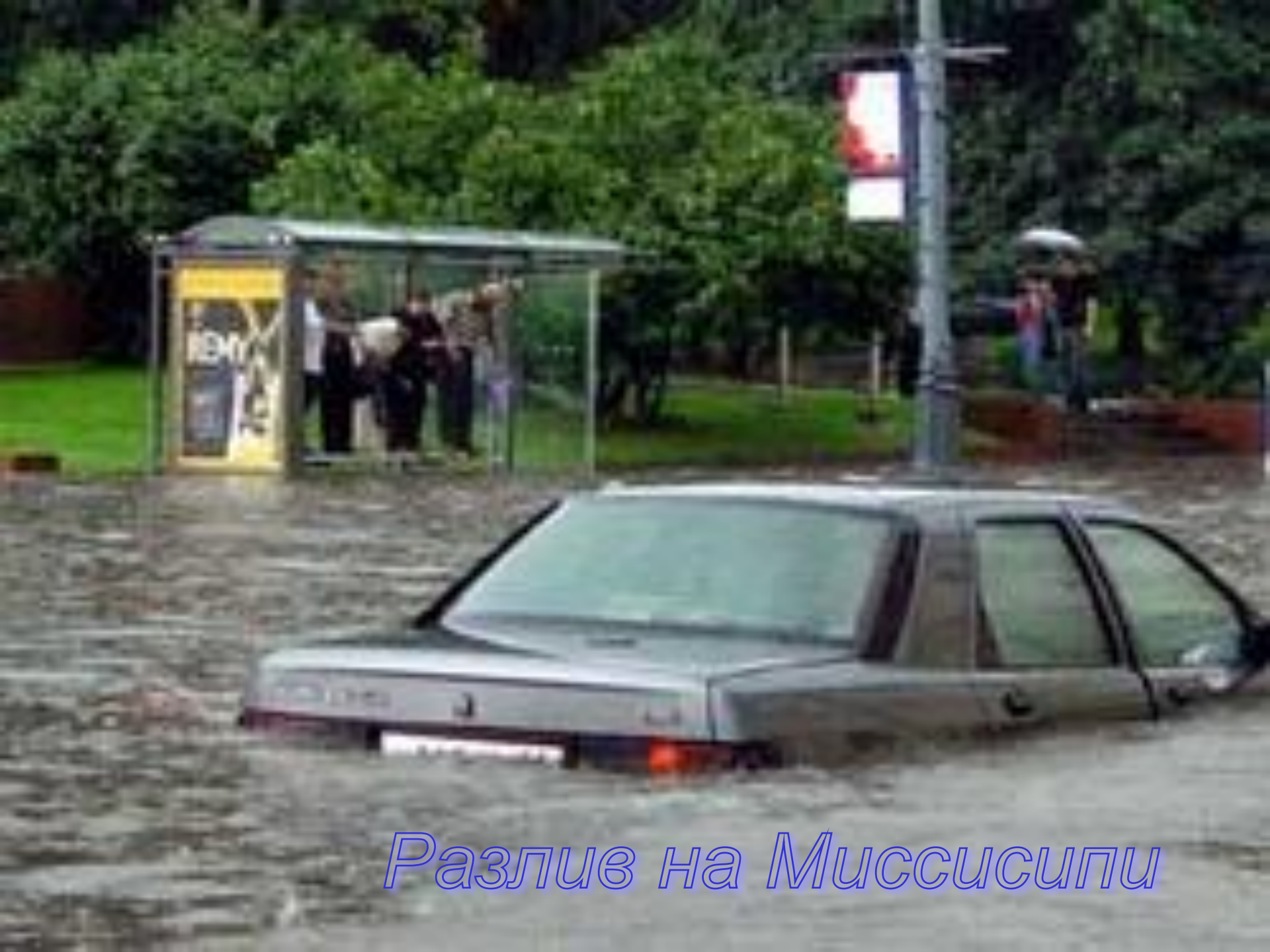
Разлив на Миссисипи