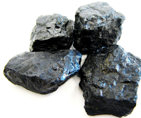
УГОЛЬ (Печорский бассейн)