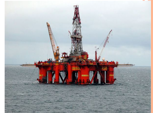
НЕФТЬ И ГАЗ