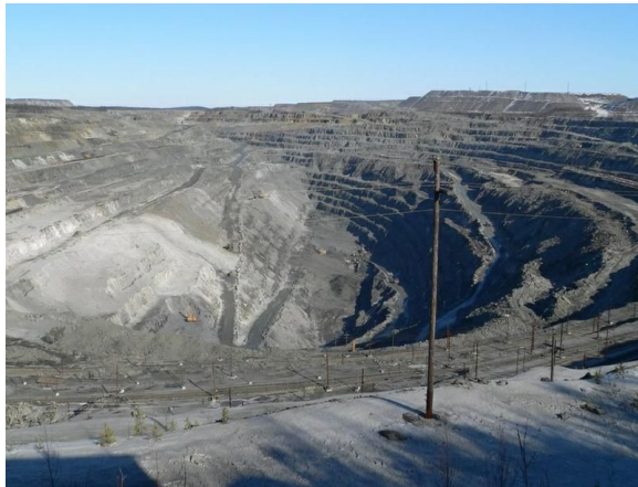
ЖЕЛЕЗНАЯ РУДА (КОСТОМУКША В КАРЕЛИИ)