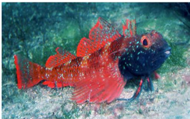
Троноп Tripterygion tripteronotus - самец, охраняющий свою территорию