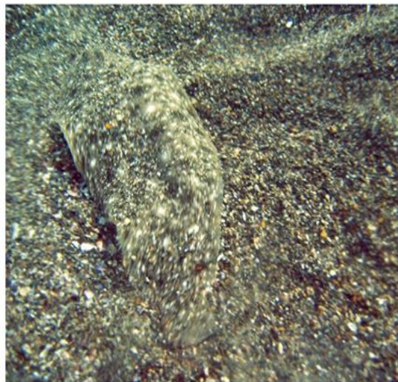
Морской язык - Solea lascaris nasuta (Pallas, 1811) Спинной плавник берет начало впереди глаз. Передняя ноздря слепой стороны тела наибольшая и заметно расширенная. Боковая линия прямая.