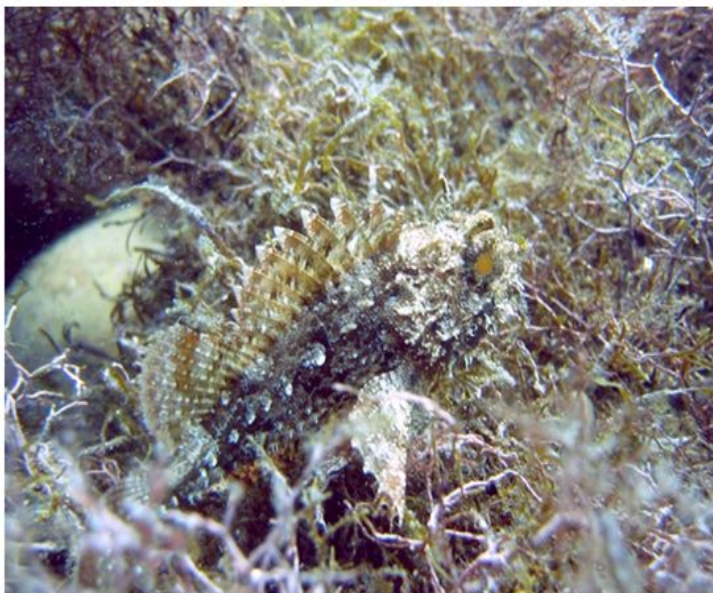
Скорпена, или морской ерш - Scorpaena porcus (Linnaeus, 1758) Тело массивное