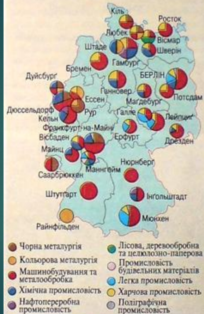
Економічна карта Німеччини