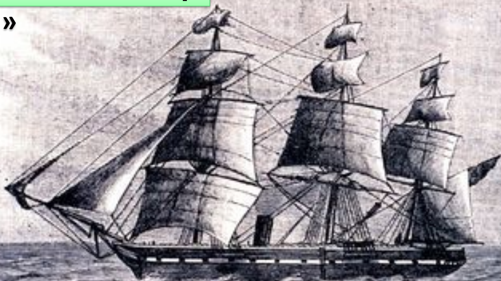
H.M.S. CHALLENGER PREPARING TO SOUND, 1872.