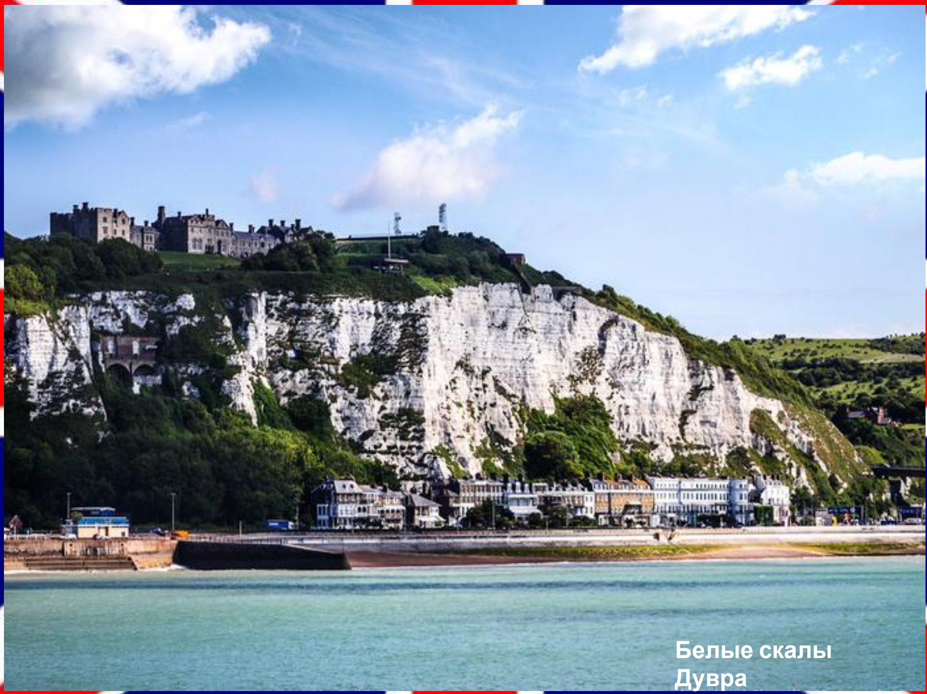
Белые скалы Дувра