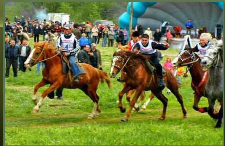
Рис.19. Конные состязания