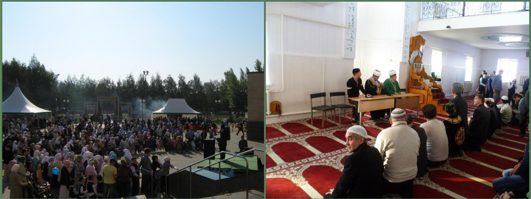
Рис.23 . Праздничная молитва в честь окончания поста دين الاسلام