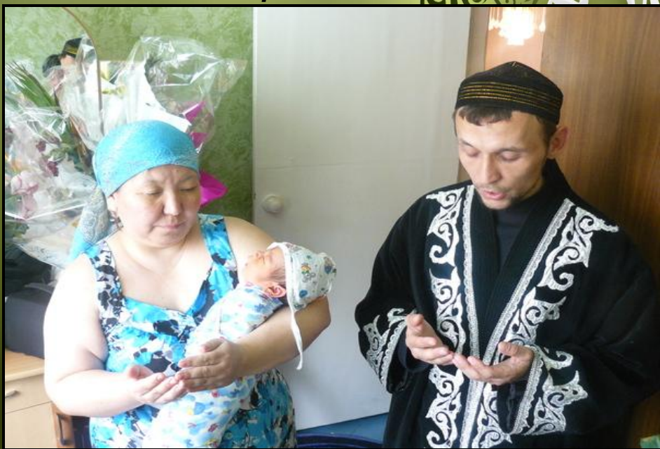
Рис.5.Завершение обряда молитвой

Традиция угощения гостей (бябй ашы) осталась с давних времен. Этим и завершается обряд связанный с рождением ребенка