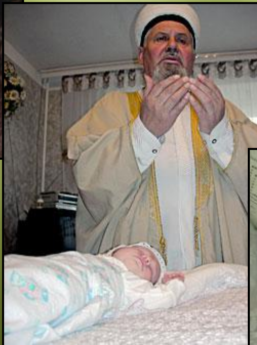
Рис.2. Проведение обряда традиционной молитвой