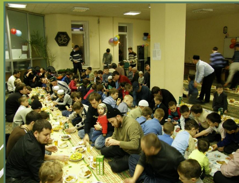
Рис.25 . Праздничное угощение мусульман

Праздновать Курбан-байрам начинают с раннего утра. Чуть свет мусульмане идут в мечеть к утренней молитве, затем идут на кладбище молиться за умерших. Для принесения жертвы мусульмане специально откармливают выбранное животное.