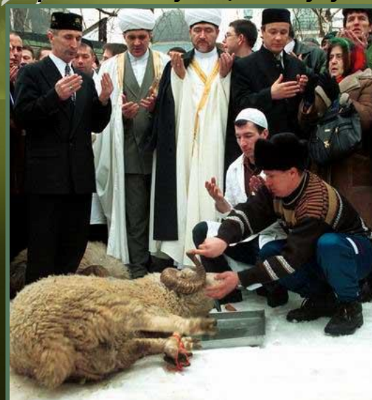
Рис.26 . Обряд жертвоприношения