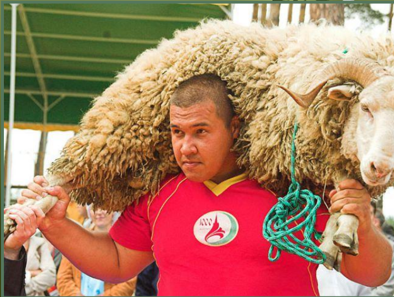
Рис.22. Победитель куреш с призом