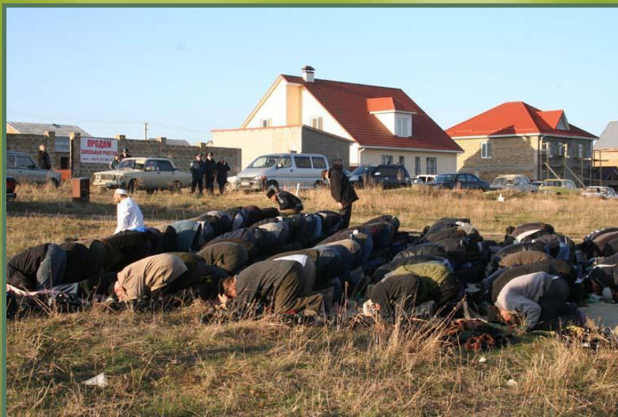
Рис.24 . Утренняя молитва