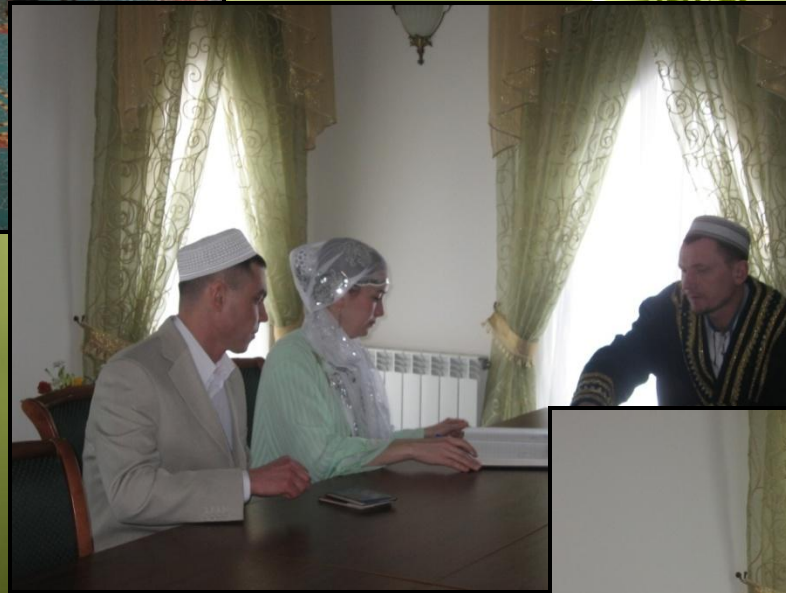
Рис.7. Регистрация брака