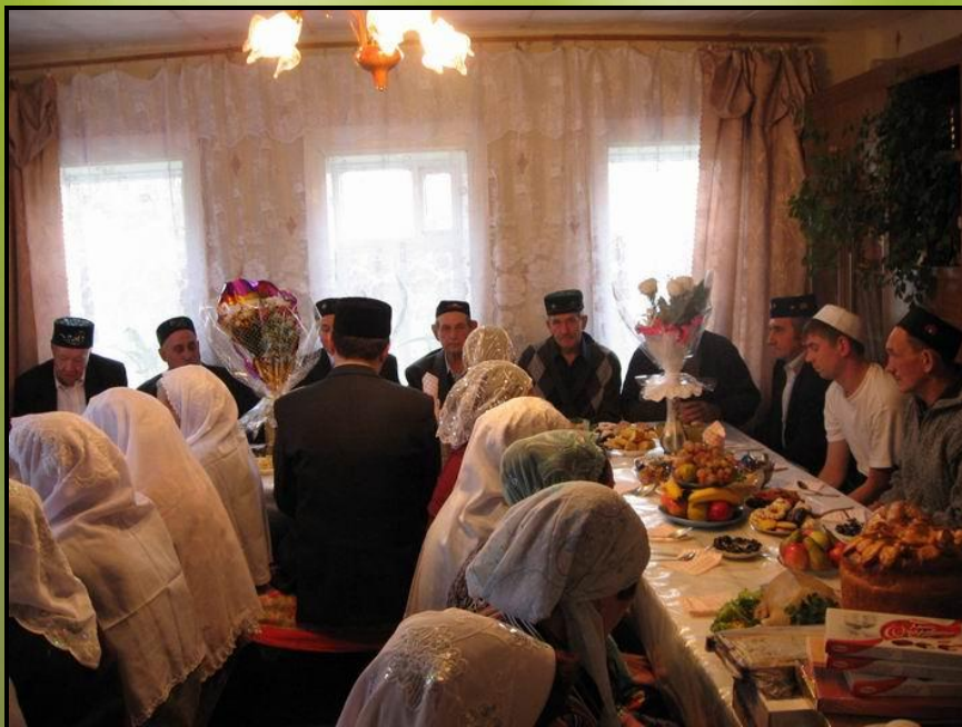
Рис.8. Угощение гостей после обряда никах

В конце XIX- начале XX века никах туй проходил в доме невесты, сейчас его иногда проводят в мечети как официальное оформление брака