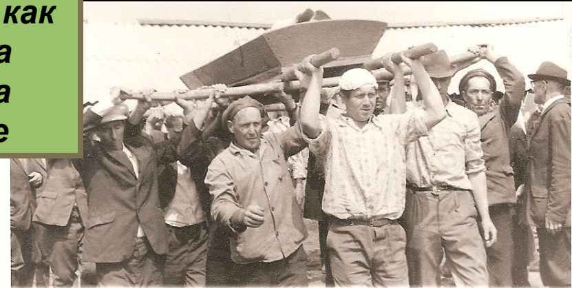
Рис.13. Носилки с покойным несут родственники