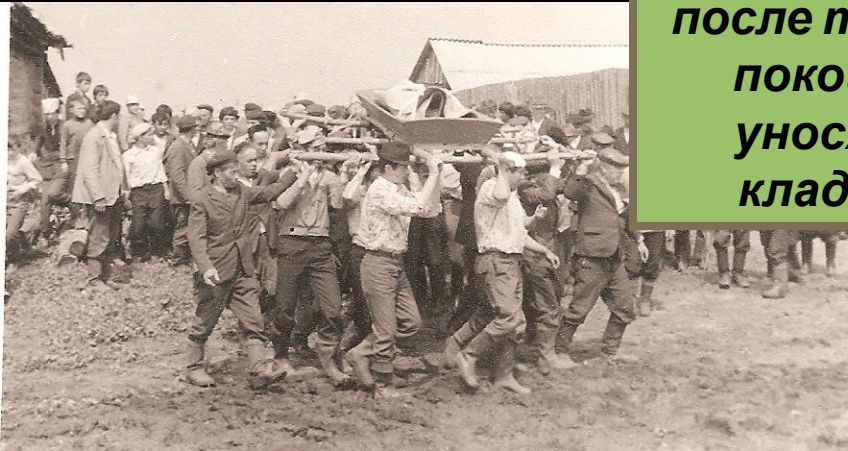
Рис.12. Похоронная процессия