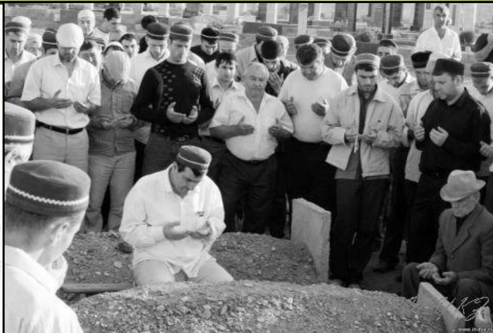
Рис.16. Чтение суры из Корана после погребения

Поминальные обряды دين السلام включают проведение многократных поминок.