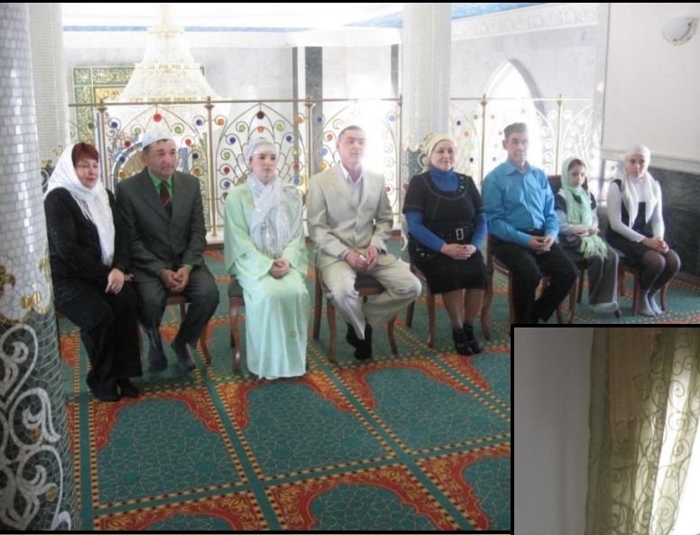
Рис.6. Никах туй

Свадебная обрядность включает несколько циклов: предсвадебный, собственно свадьба и послесвадебный.