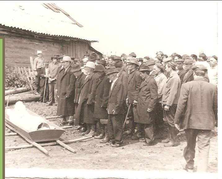
Рис.11. Проведение намаза перед отправлением на кладбище