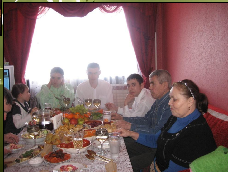
Рис.9. Завершение обряда никах

Особое место в обрядах второго дня свадьбы занимают разнообразные формы трудовых испытаний молодой.