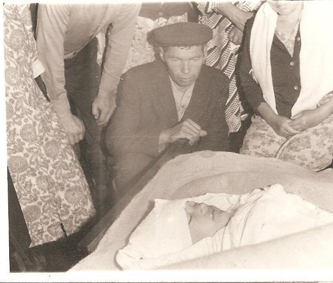
Рис.10. Прощание с покойным

Женщины в похоронной процессии не участвуют, они читают молитвы, также моют в доме пол, стены после того, как покойника уносят на кладбище