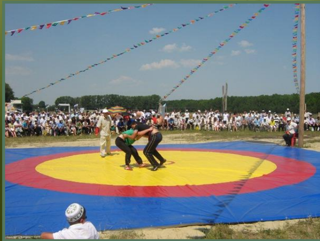
Рис.18. Борьба Куреш