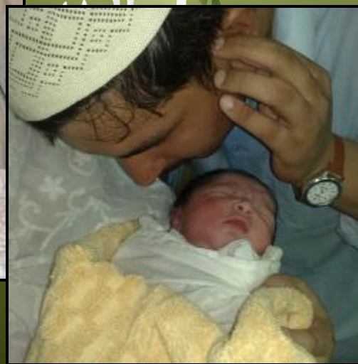
Рис.3. Обряд имянаречения