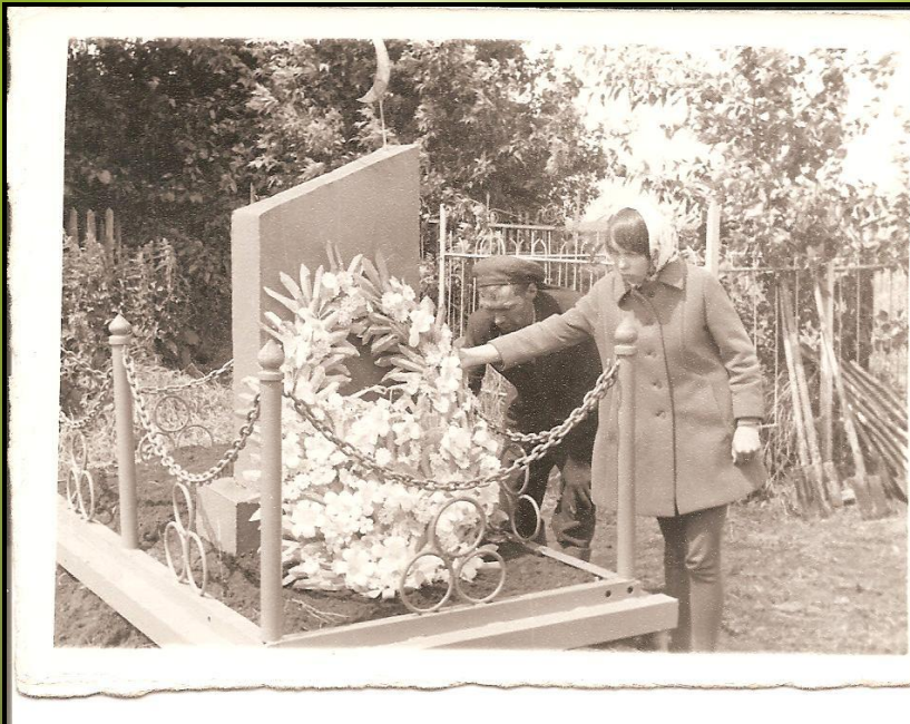
Рис.15. Могила покойного