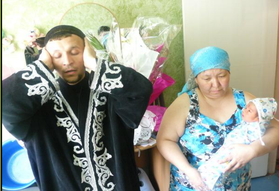
Рис.4.призыв азана в честь ребенка

Обряд имянаречения проводится и в настоящее время: приглашается мулла, читает молитвы, затем нашептывает на ухо новорожденному азан и произносит имя младенца;