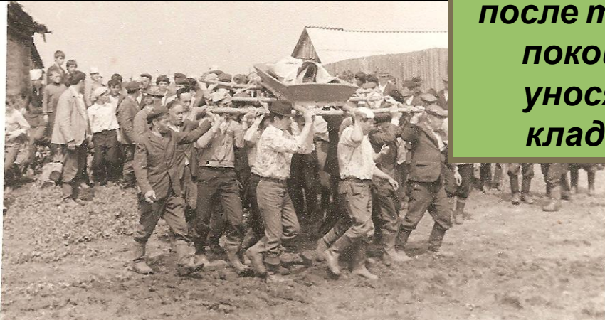
Рис.12. Похоронная процессия