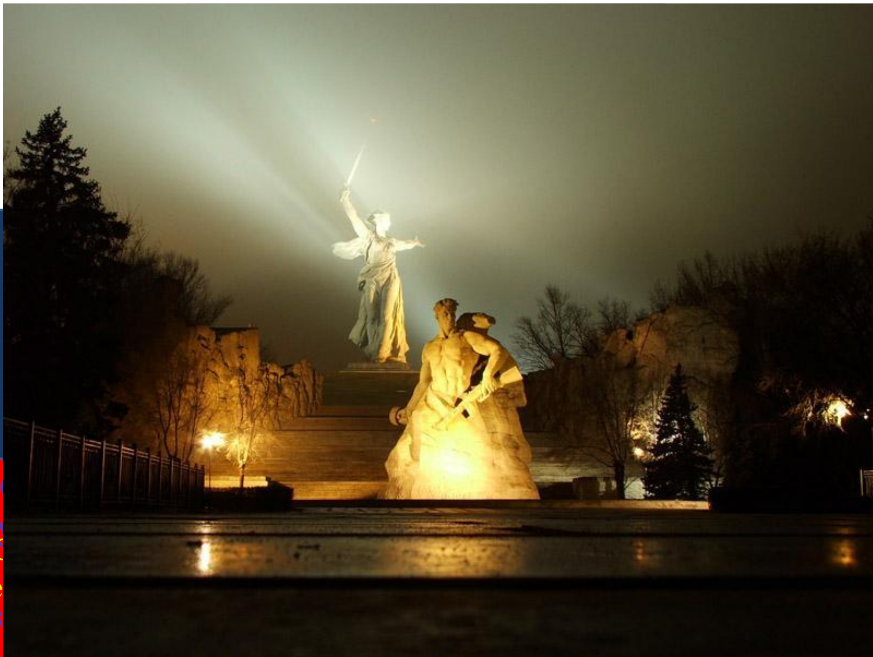
«Первая с мечом и щитом в руках»