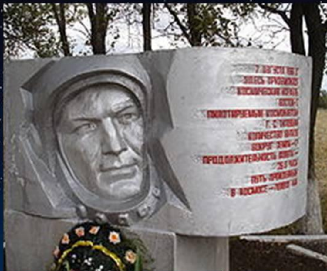
Памятник на месте приземления космического корабля «Восток -2»