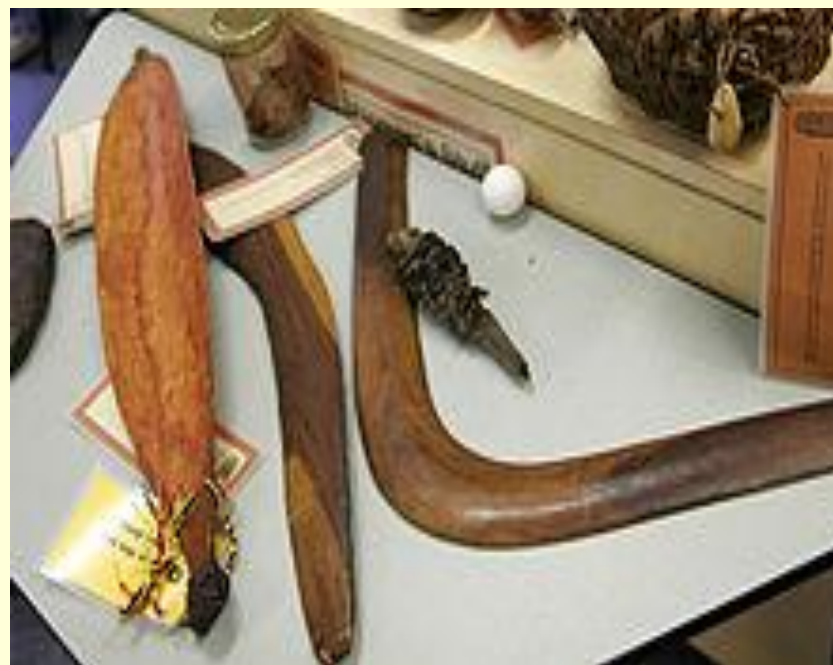
Бумеранг ва бошқа қурол-яроғлар