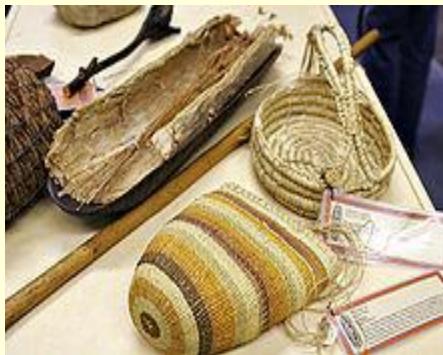
Уй - рўзғор буюмлари