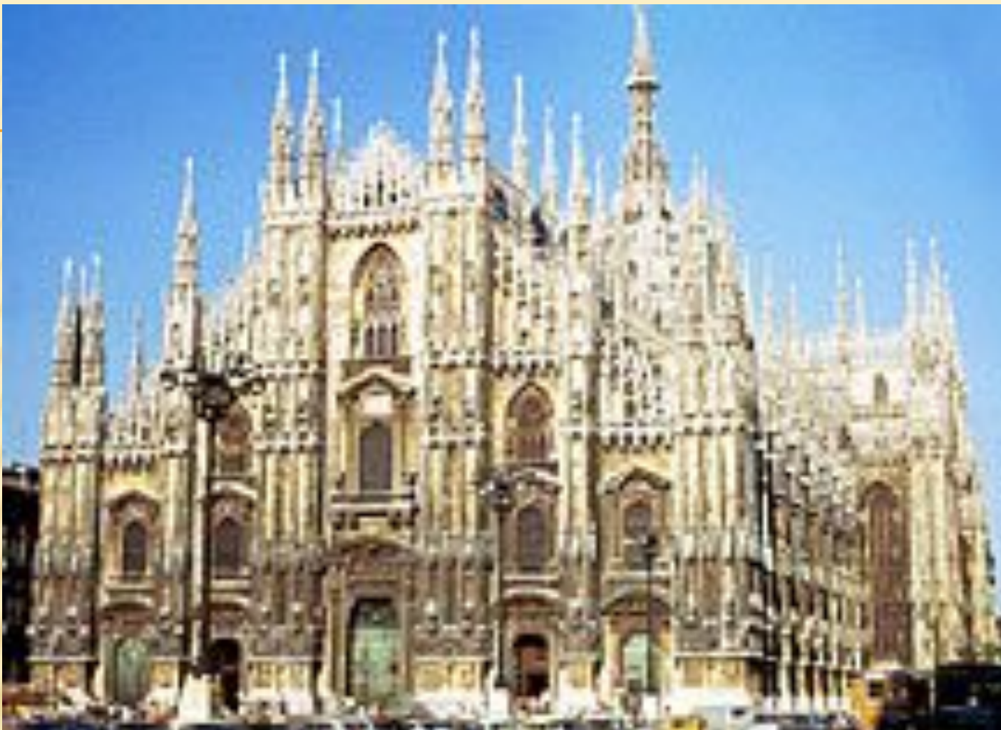
Милан. Кафедральный собор Дуомо, больше известный как Миланский собор