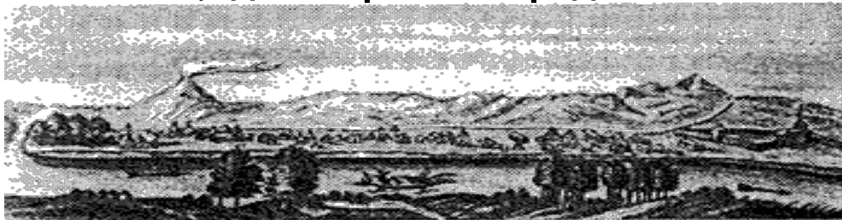
Нижнекамчатский остров (по С. Крашенинникову)

Взбунтовавшиеся служилые люди посадили Атласова в темницу, из которой он бежал и до января 1711 года находился в Нижнекамчатске, где во время очередного мятежа казаков был убит.