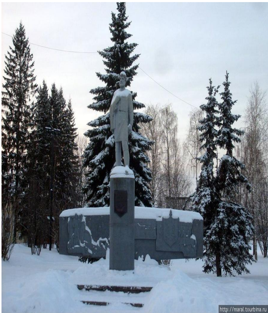
Памятник В. Атласову в г. Великий Устюг