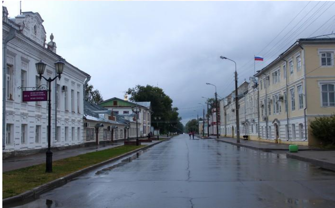
Улица В. Атласова в Великом Устюге