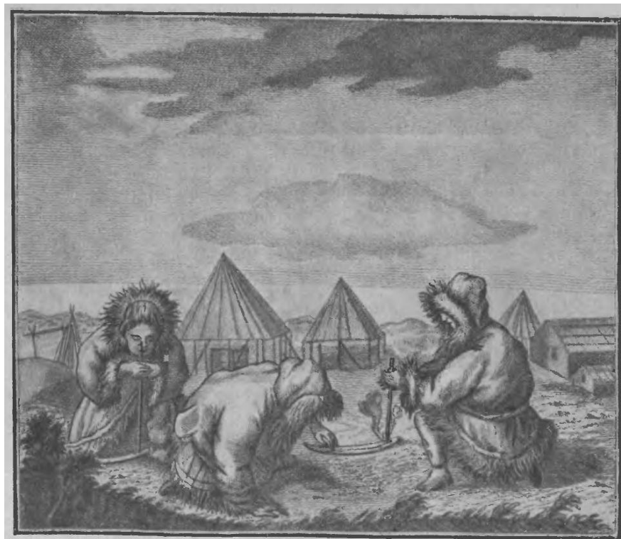
Камчадалы, добывающие огонь из дерева.

Иллюстрация к первому изданию „Описания Земли Камчатки“.