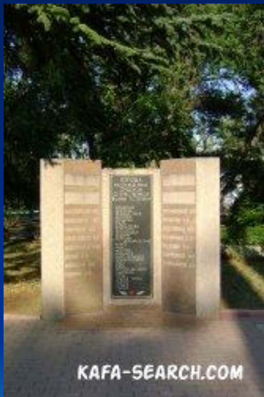
Памятник посвященные Великой Отечественной Войне