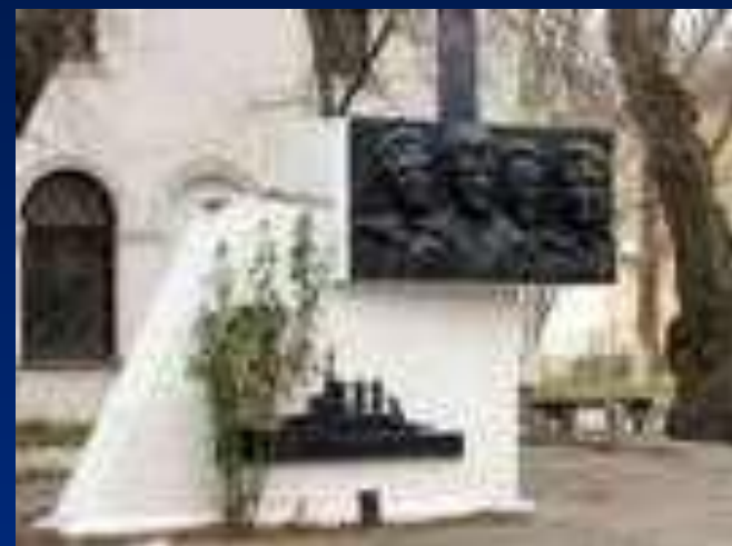
Памятник жертвам большевистского террора.