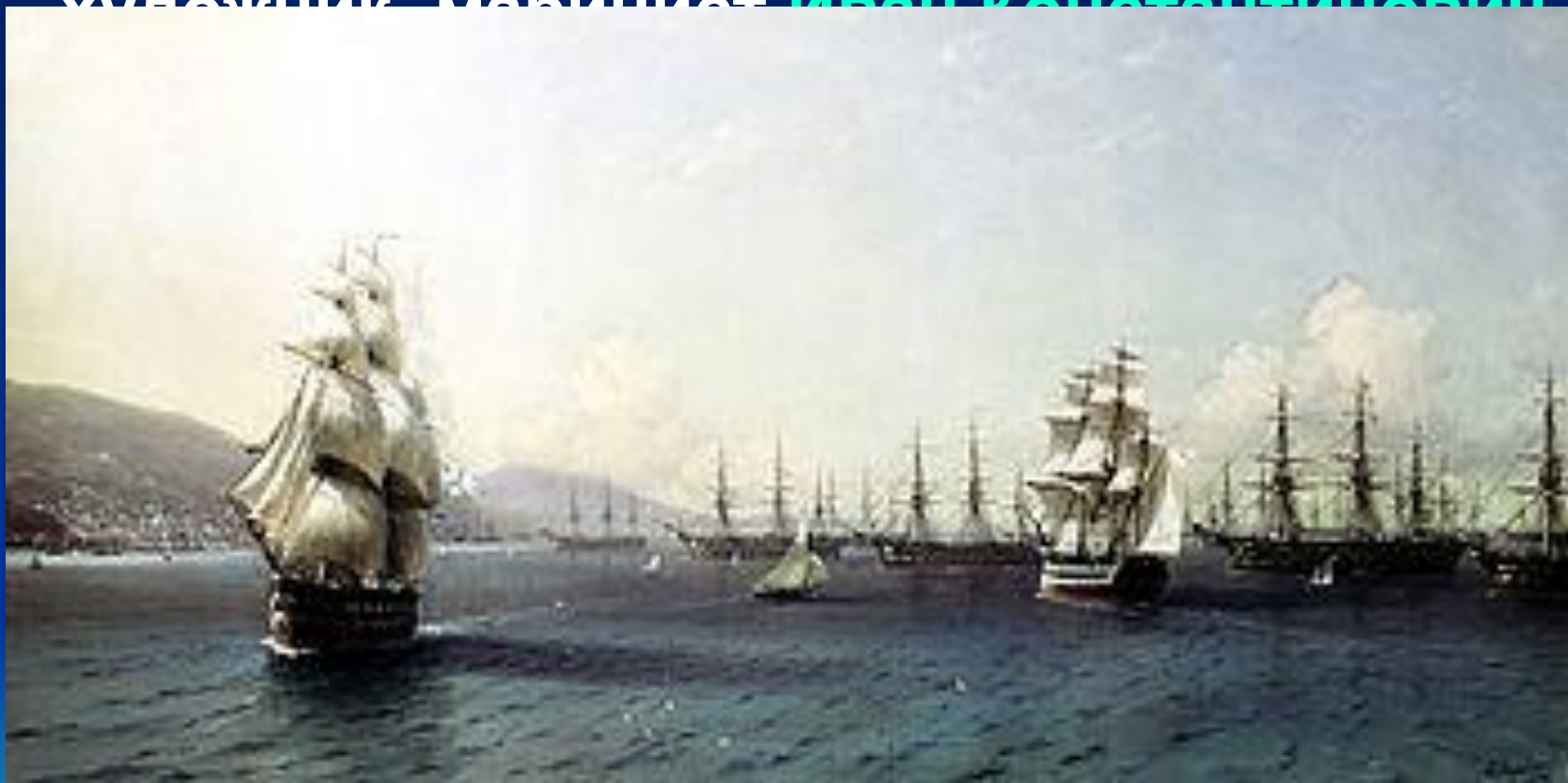
И. Айвазовский «Черноморский флот в Феодосии»