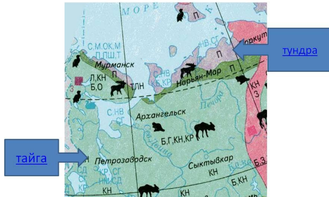
Природные зоны Европейского Севера

Зона тундры и тайги. Хвойные леса – природное богатство района.