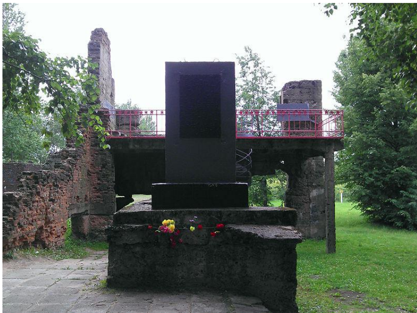
Памятник «Защитником Киришской земли» (1941-1943)