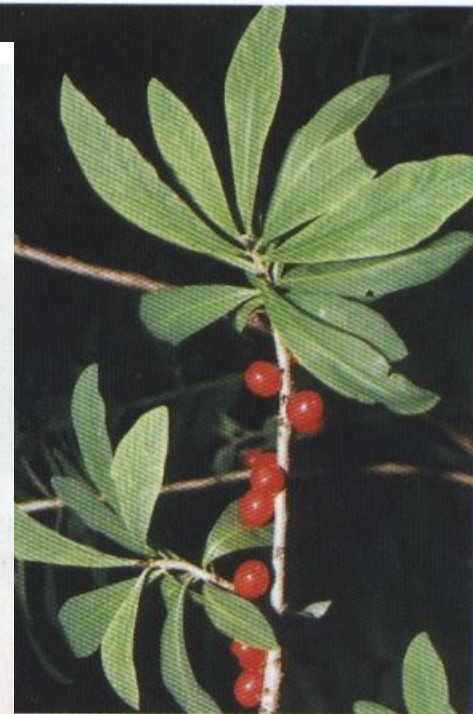
Волчье лыко с плодами