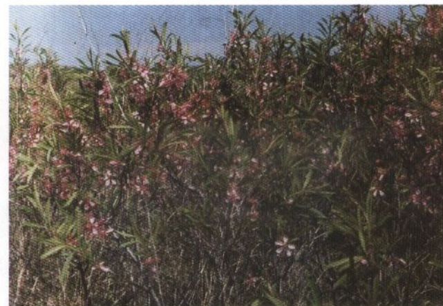
Островцовская лесостепь. Цветущий миндаль низкий