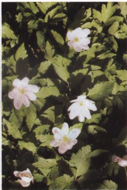
Арбековский лес. Ветреничка алтайская