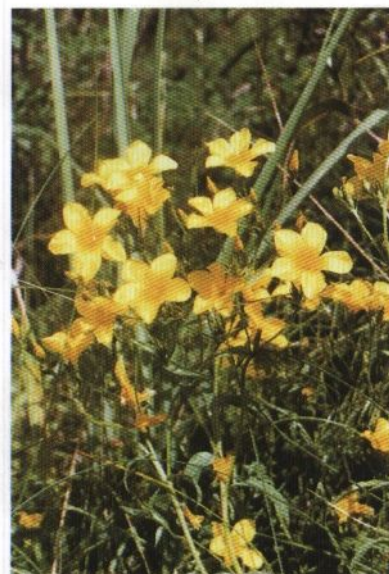
Островцовская лесостепь. Лен желтый