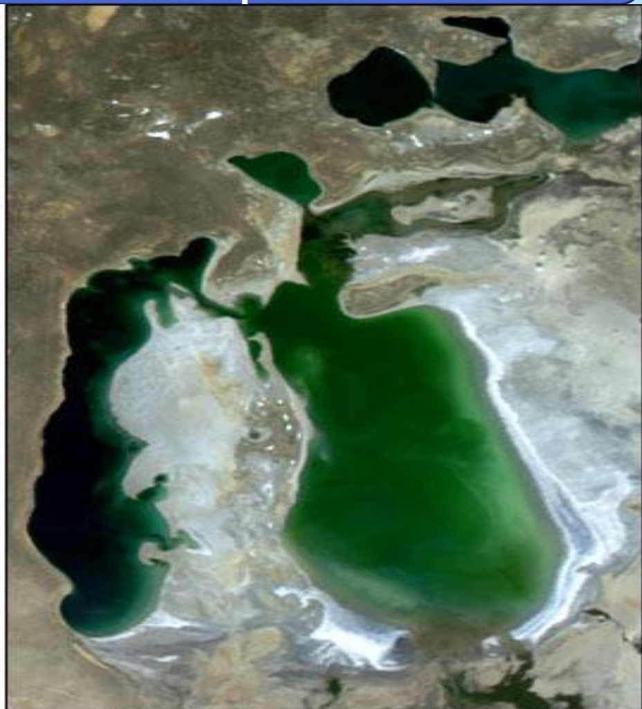
August 12, 2003