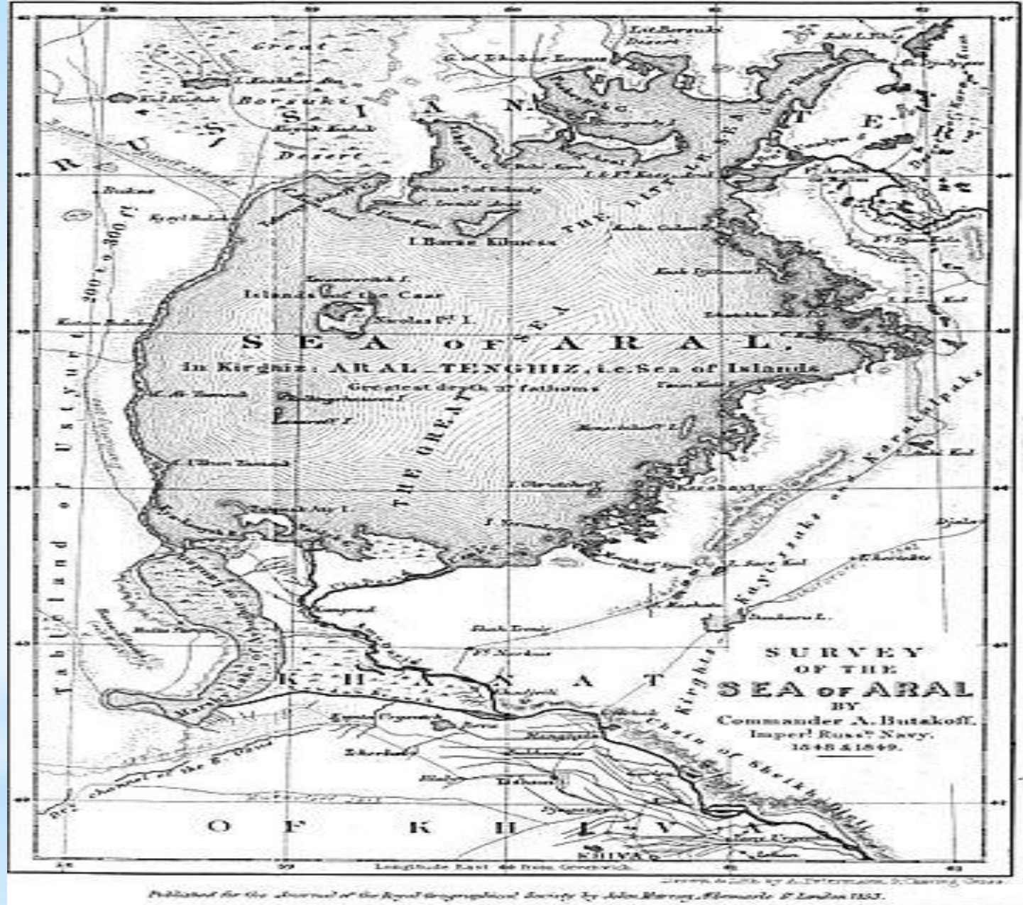
Арал теңізінің картасы, 1853 жыл