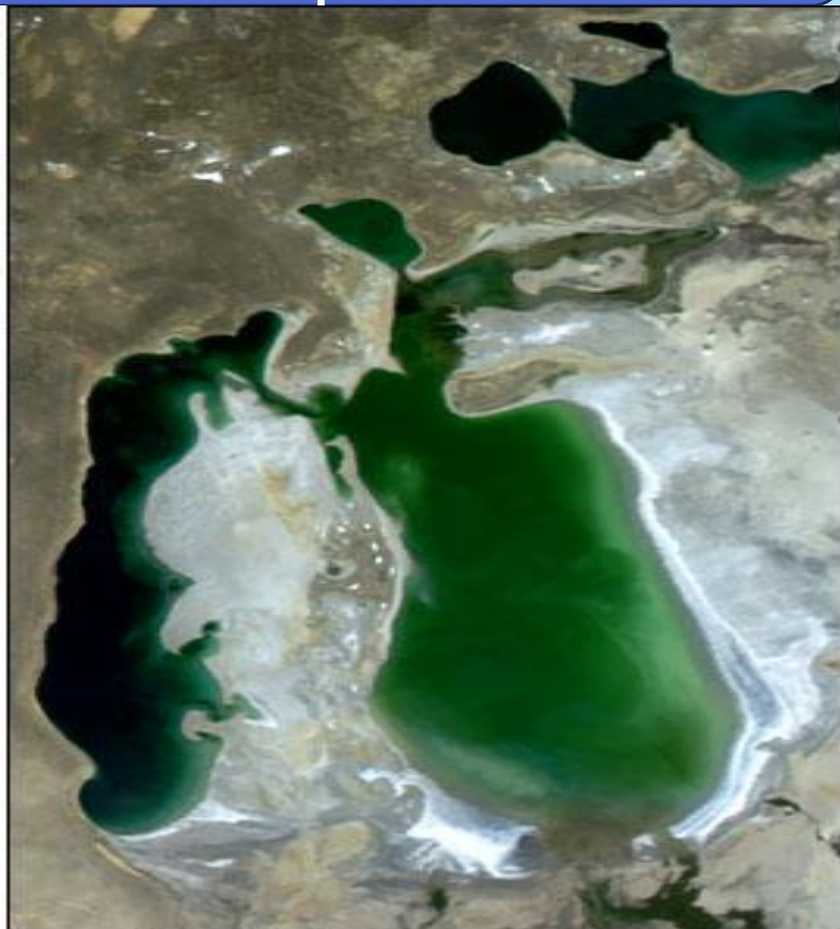
August 12, 2003