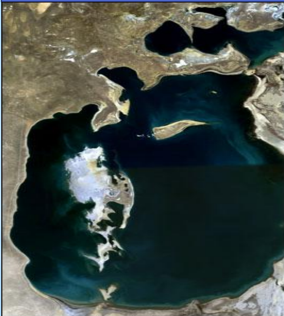
July - September, 1989

Теңіз Үлкен арал және Кіші Арал болып екіге бөлініп жатыр.