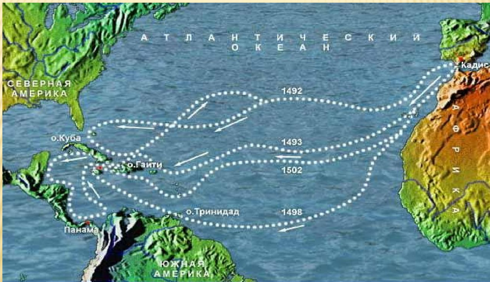
Маршруты плаваний Христофора Колумба.