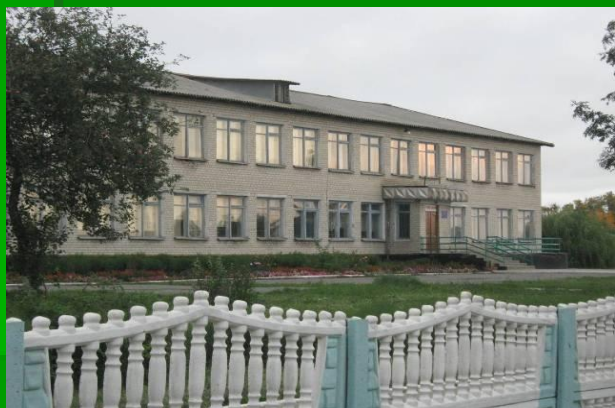
МБОУ «Большебыковская СОШ» 2008 год