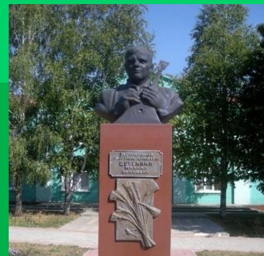
Памятник Щербину М.А