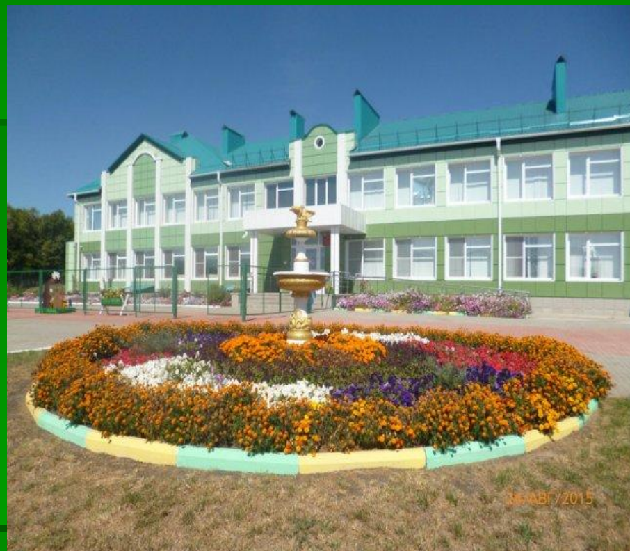
МБОУ «Большебыковская СОШ» после капитального ремонта 2015 год