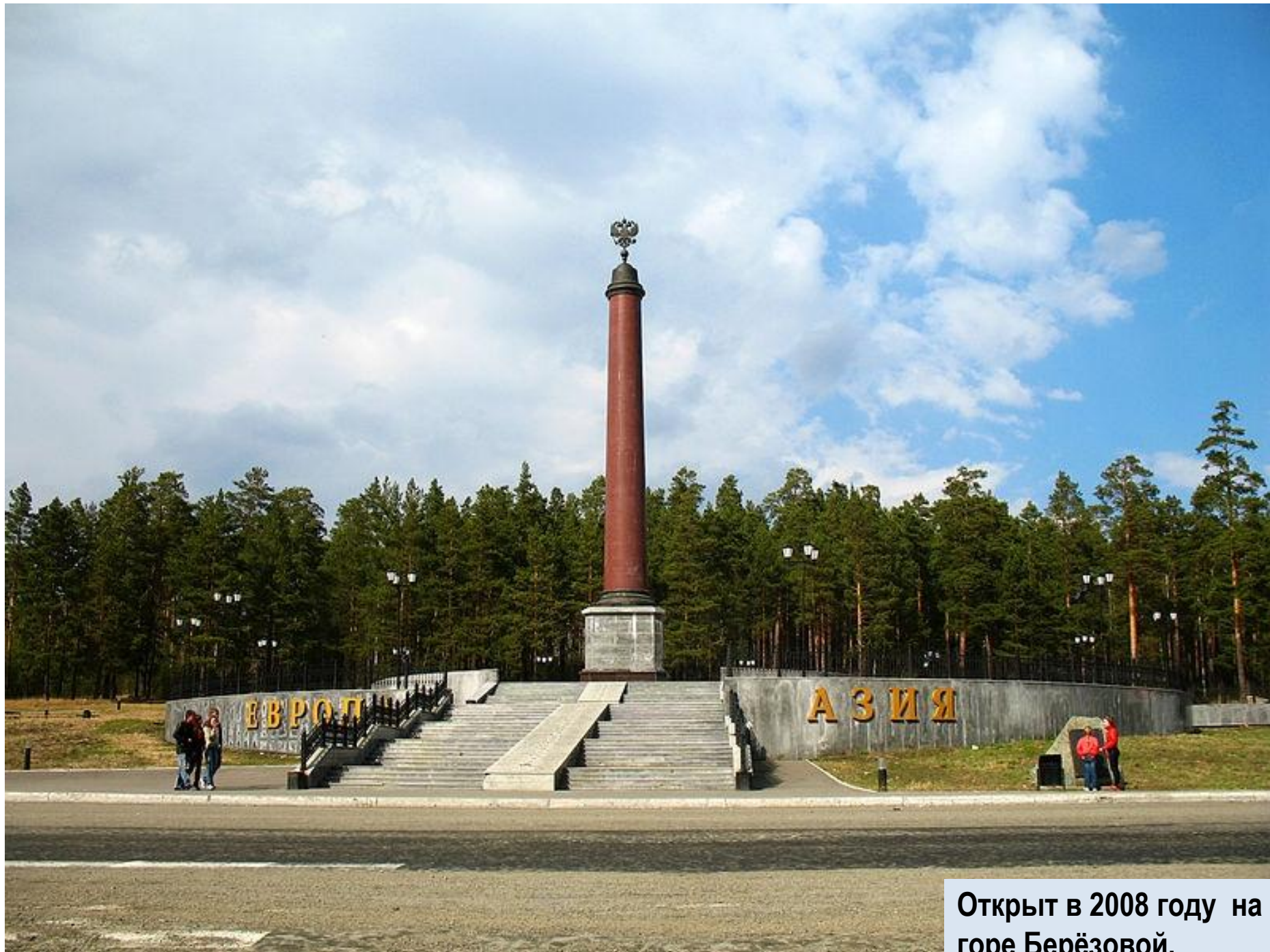
Открыт в 2008 году на горе Берёзовой.