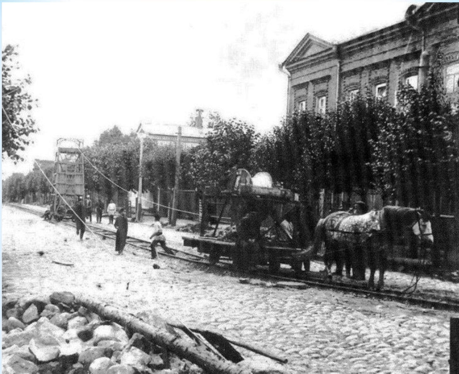
Первые трамваи на конной тяге