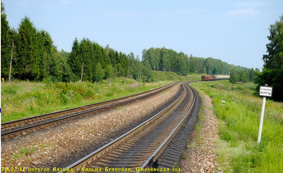
16.07.11 перегон Вязьма - Вязьма-Брянская, Смоленская обл