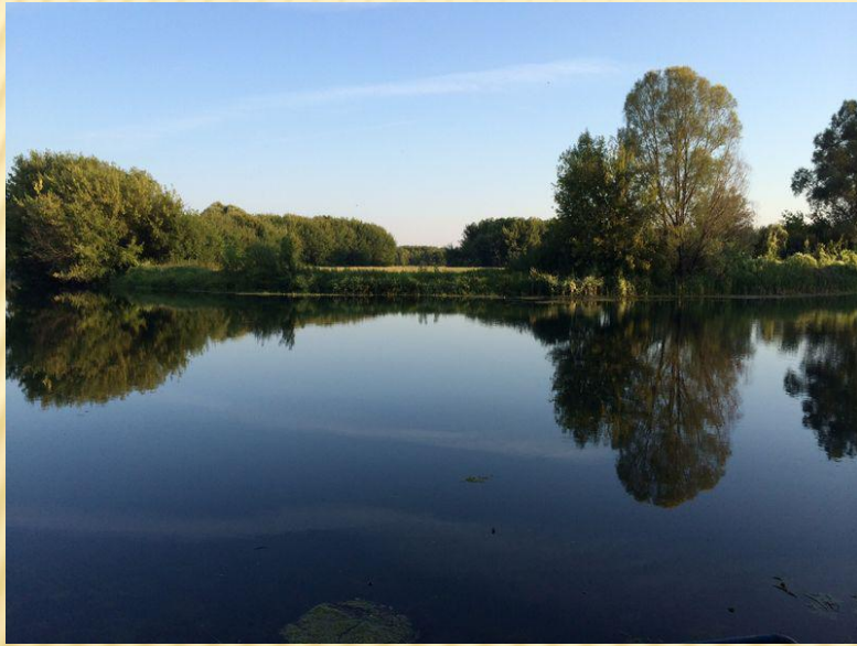
р. Пьяна. Бутурлино

Заказник — охраняемая природная территория, на которой под охраной находится не природный комплекс, а некоторые его части: только