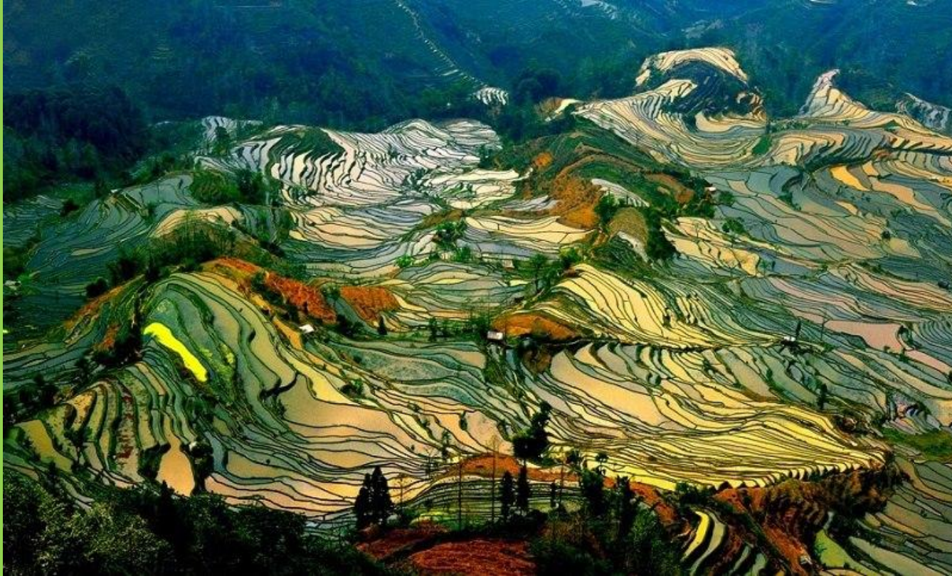
(Рисовые террасы Хунха-Хани)

3) Предгорные и горные районы в Индии, КНР, КНДР, Японии, Шри-Ланке и др. (создаются искусственные террасы под сельскохозяйственные угодья)