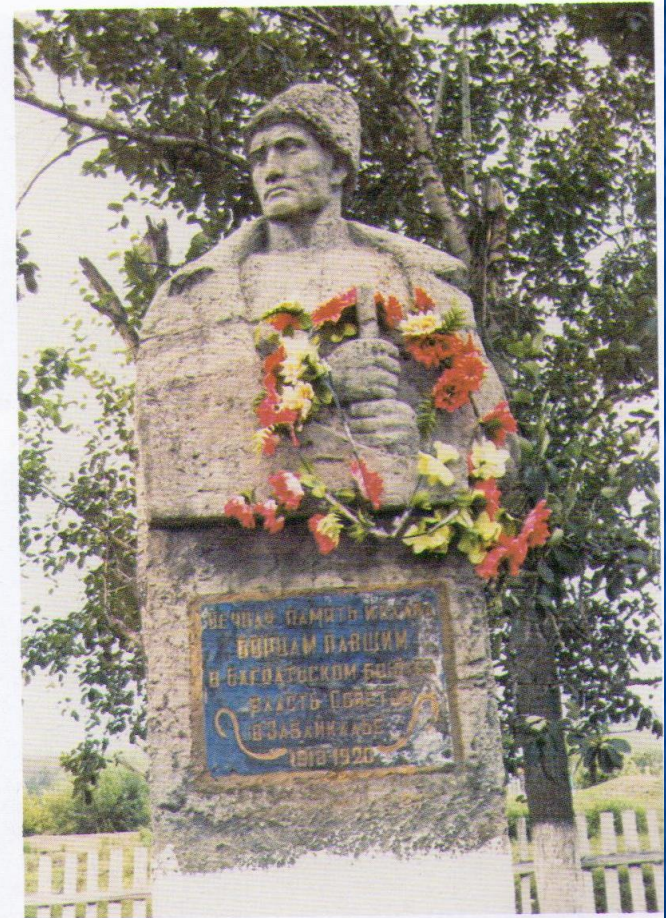
85. Памятник погибшим в Гражданской войне