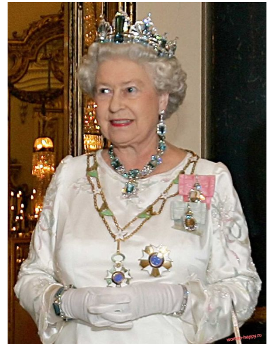
Королева Великобритании Елизавета II