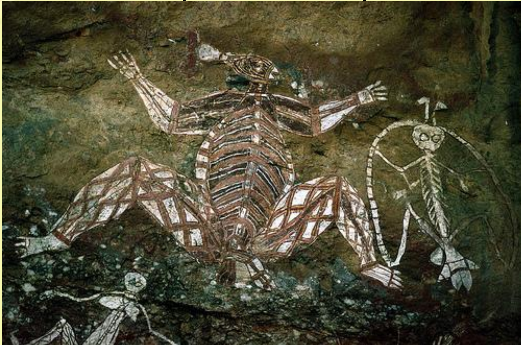
Рисунки на коре Эвкалипта