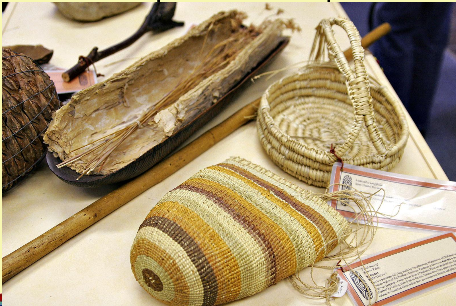
Образцы рукоделия аборигенов Австралии