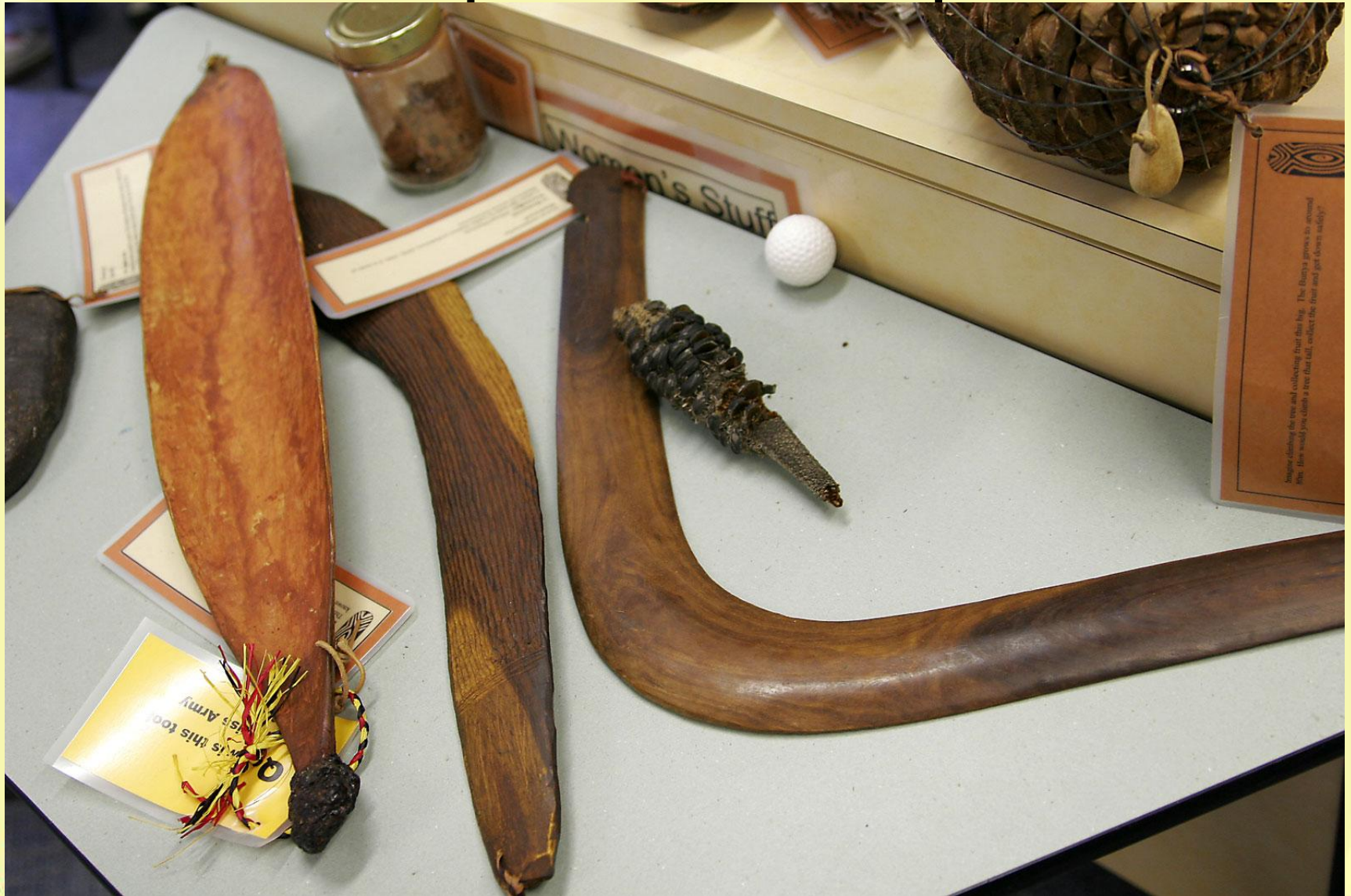
Оружие аборигенов - бумеранг