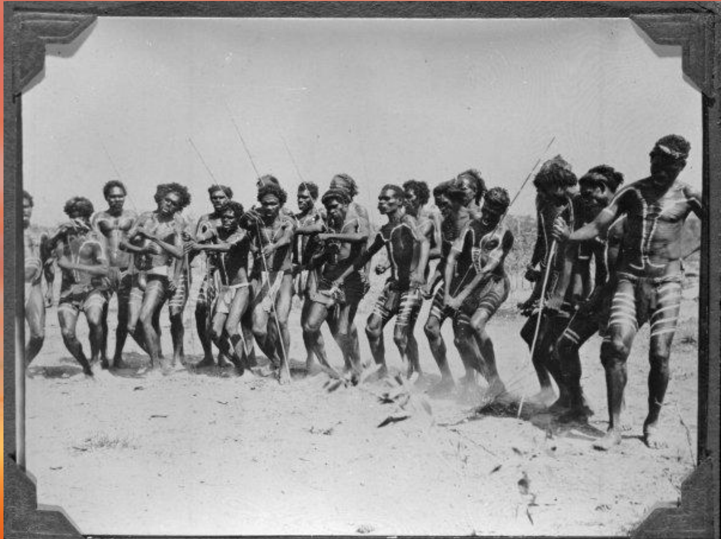
A Native Dance