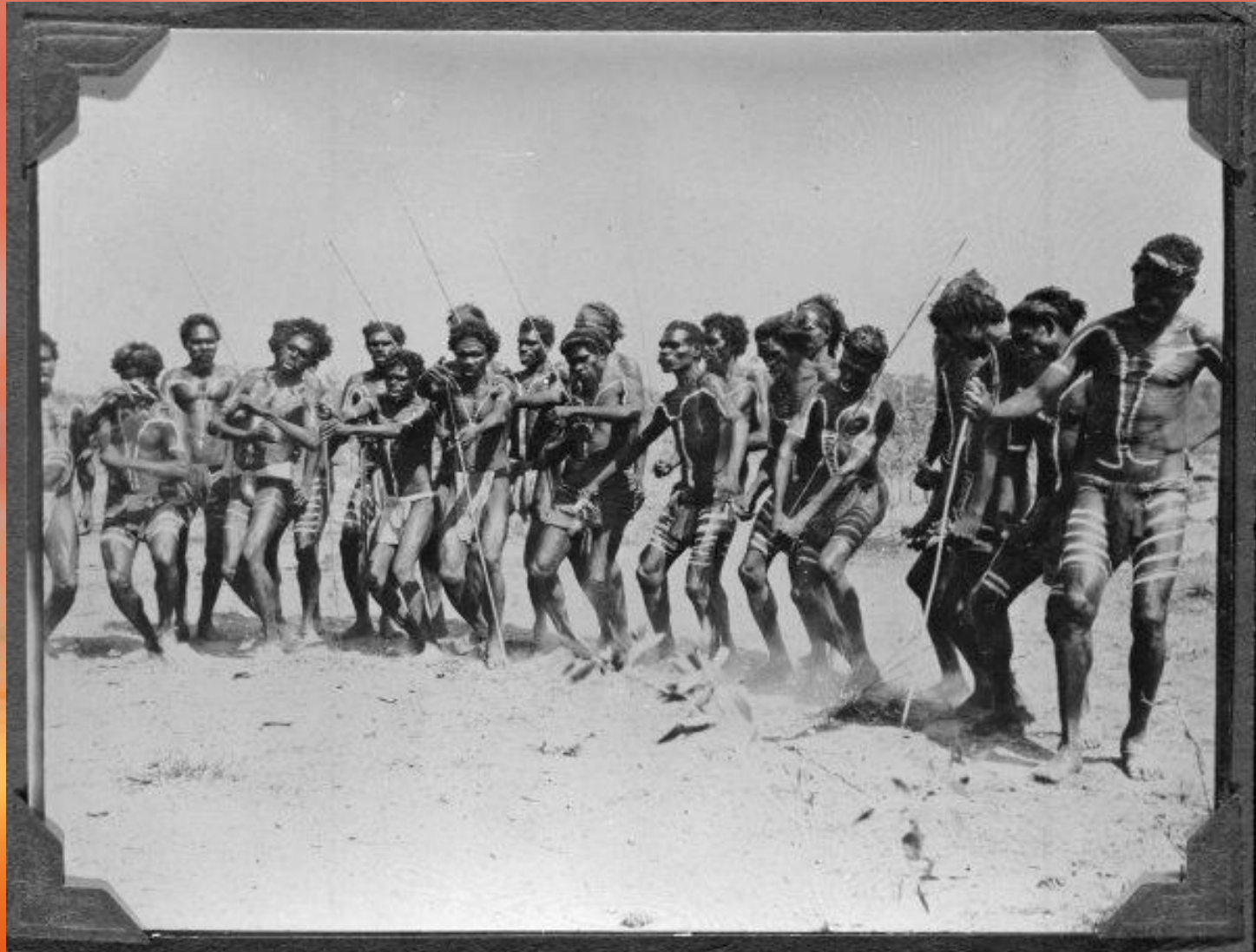
A Native Dance