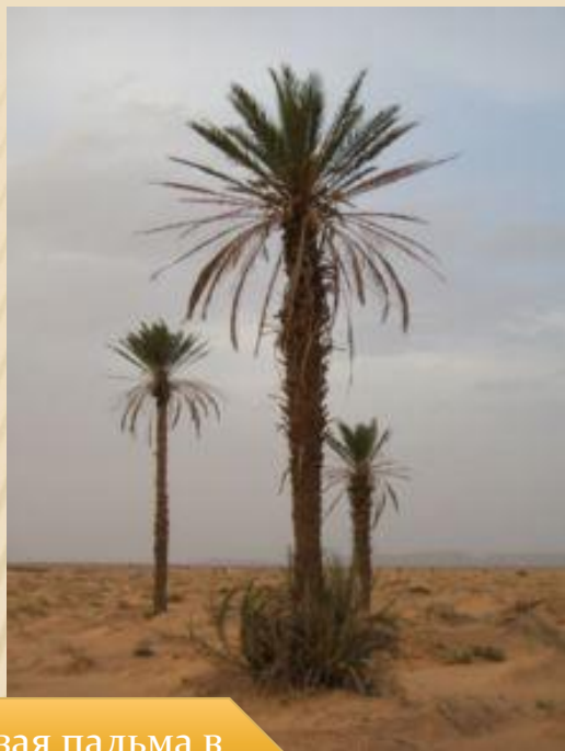
Финиковая пальма в сахарском оазисе Эрг- Шебби