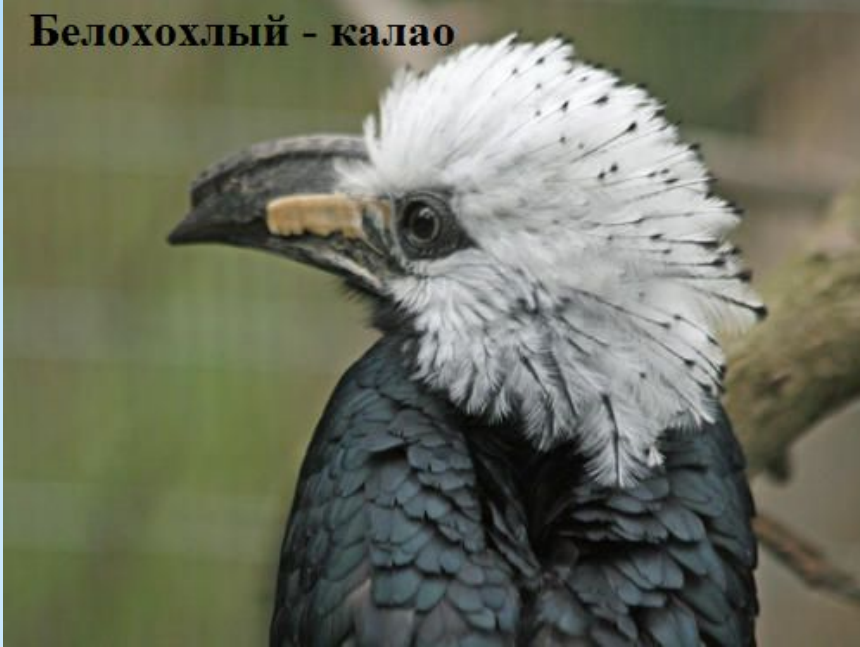
Белохохлый - калао