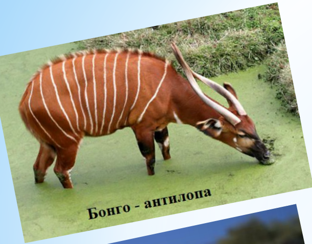
Бонго - антилопа