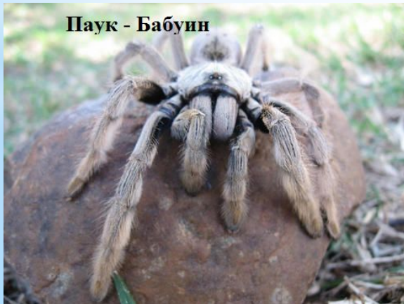
Паук - Бабуин