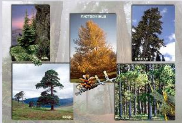
Основные породы деревьев в российской тайги.