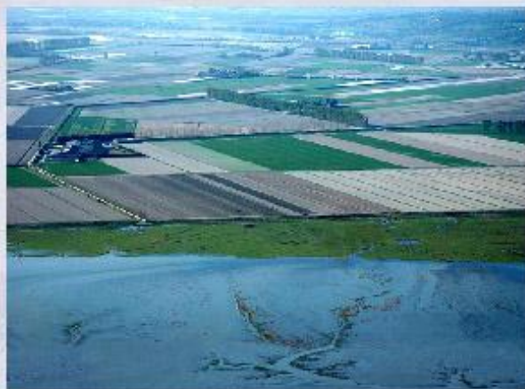
Польдеры — земли, отвоёванные у моря в Нидерландах.

Сокращение обрабатываемых земель происходит не во всех странах. Страны, обладающие большой территорией и значительными земельными ресурсами, часто осваивают целинные земли, то есть ту часть земельного фонда, которая ранее не использовалась в сельскохозяйственном производстве. Государственная политика освоения целинных земель проводилась в Советском Союзе в конце 50-х - начале 60-х годов прошлого века. К сожалению, эта кампания в нашей стране привела к деградации ранее плодородных земель.