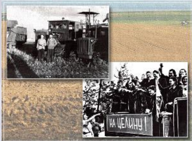
Освоение целины в СССР.