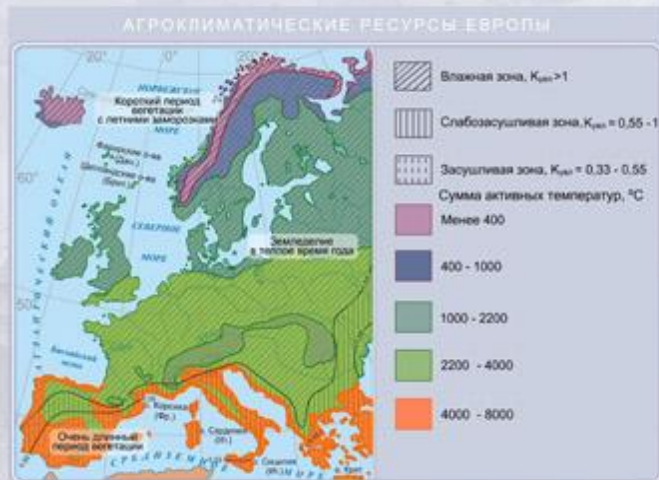
Агроклиматические ресурсы Зарубежной Европы.

Соотношение тепла и влаги, величина солнечной радиации и сезонность климатических изменений, влияющие на хозяйственную деятельность человека, называются агроклиматическими ресурсами . Географическое распределение этих ресурсов находит отражение на агроклиматической карте.