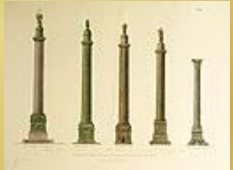
Сравнение Александровской колонны, колонны Траяна, колонны Наполеона, колонны Марка Аврелия, и так называемой "колонны Помпея"