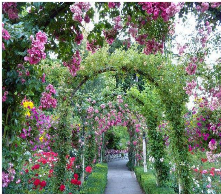
Донецький ботанічний сад

Терени Донбасу являють собою хвилясту рівнину, рясно порізану річковими долинами, балками та ярами. Відпочинок на Донеччині принесе вам справжнє задоволення. Донеччина (Україна) — зелений регіон із множиною красивих скверів, парків, бульварів, де ви можете погуляти (особливу увагу зверніть на Парк кованих фігур), також ви можете відвідати Донецький ботанічний сад, Старий і Новий Планетарії, аквапарк.