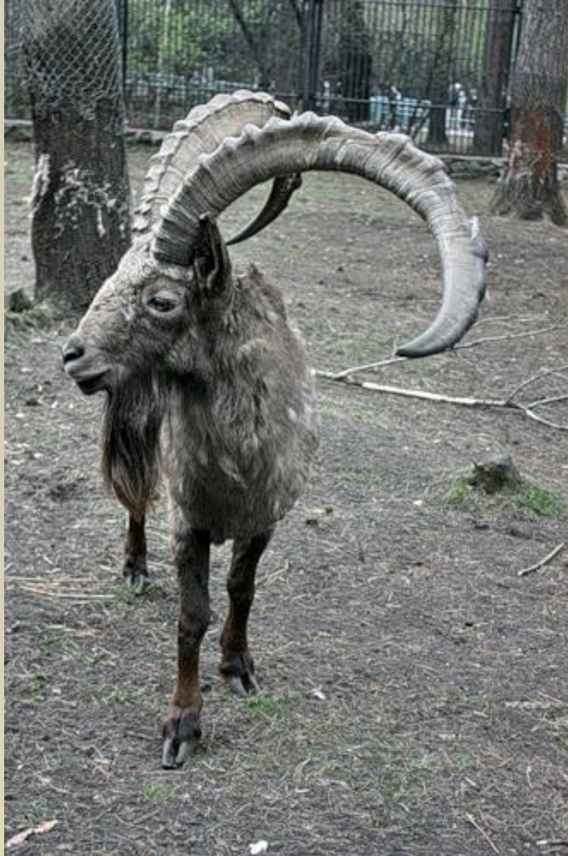
Сибирский горный козёл