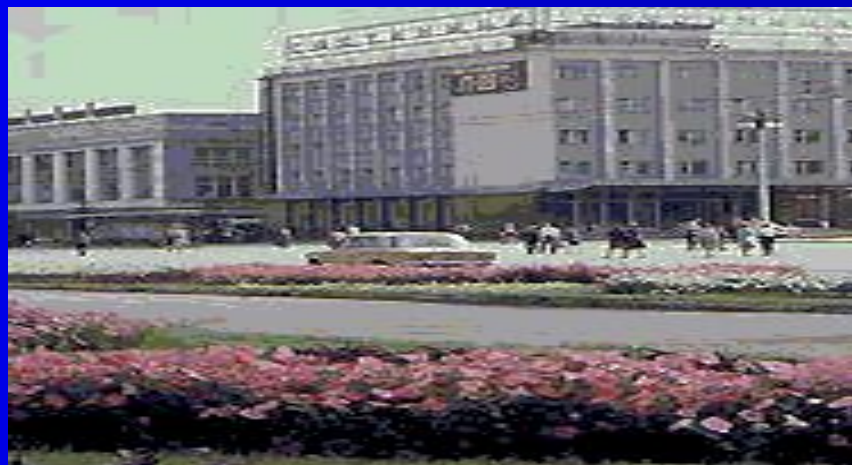
Центральная площадь города