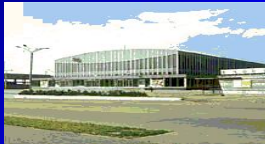
Здание краевой администрации