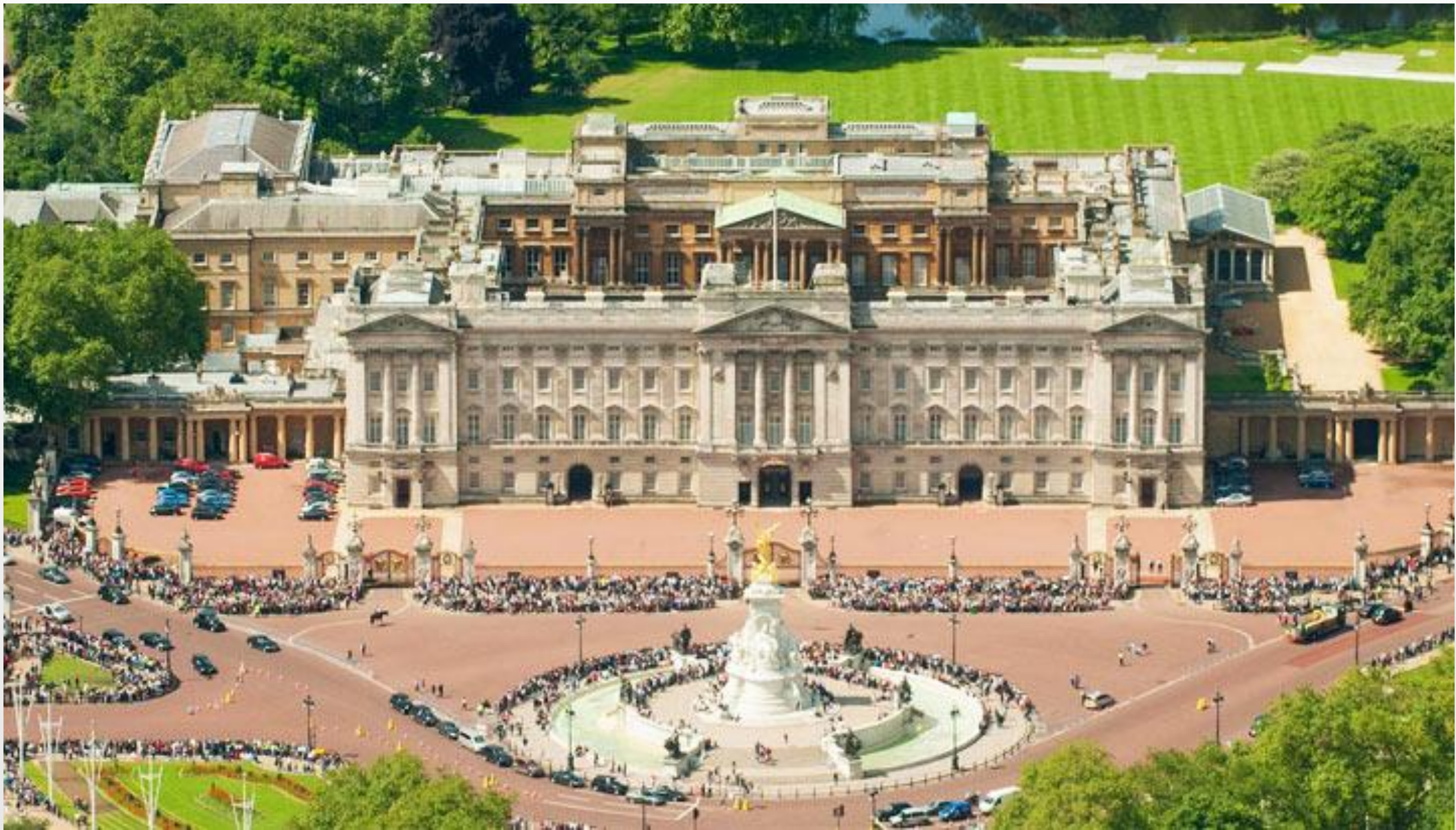
Букингемский дворец. Сейчас он выполняет роль лондонской резиденции королевы Великобритании.