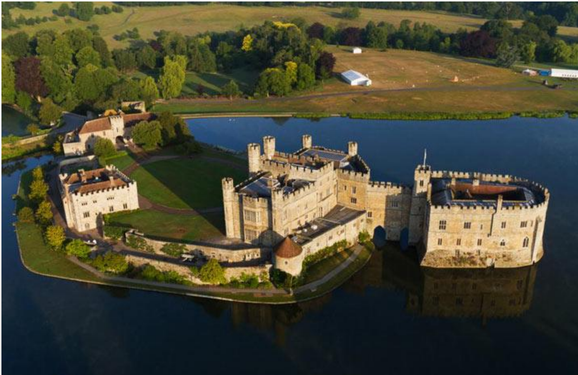
Построенный в 11 веке замок Лидс