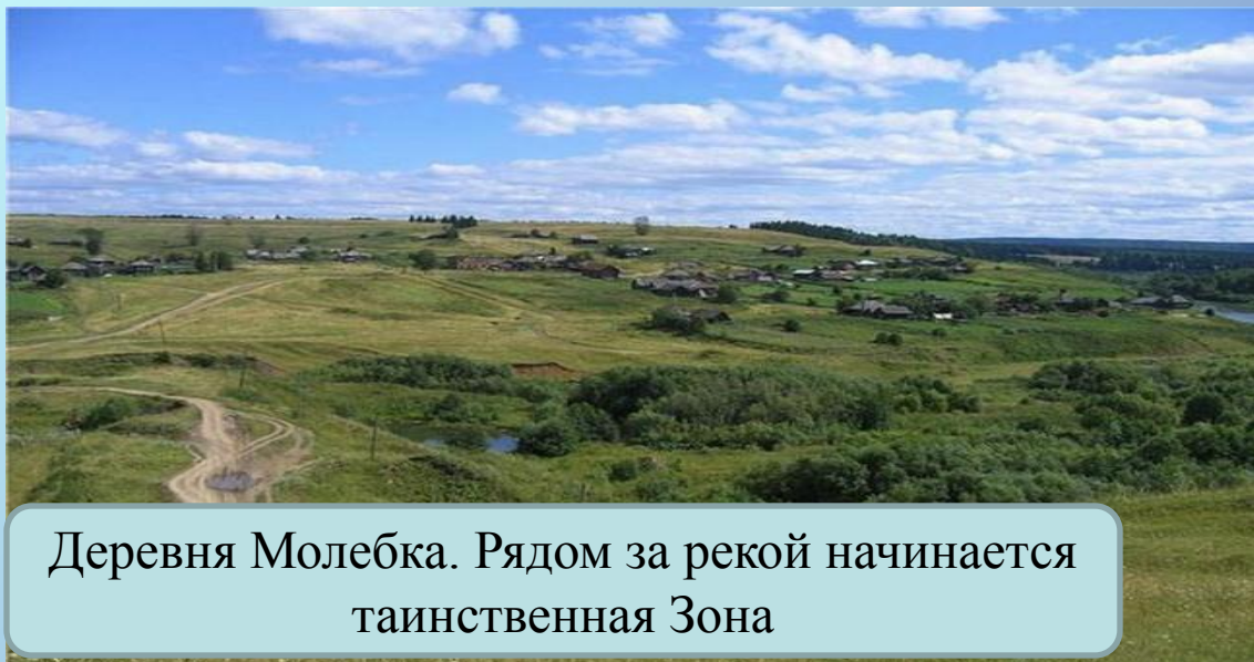
Деревня Молебка. Рядом за рекой начинается таинственная Зона