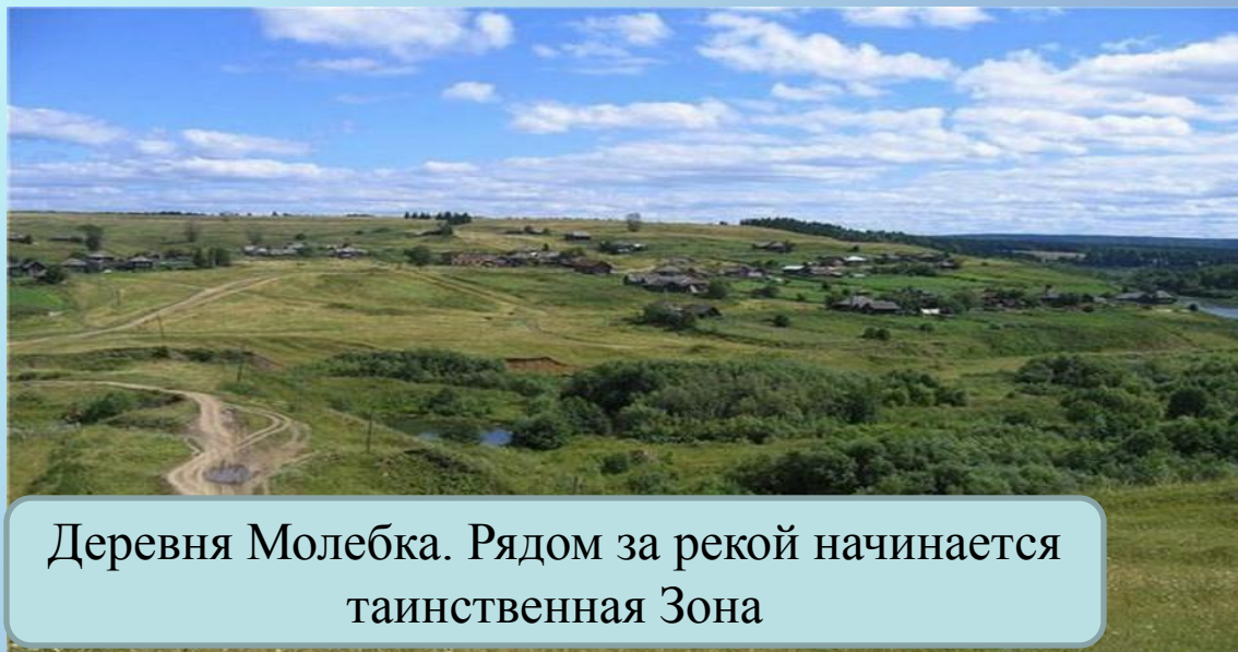
Деревня Молебка. Рядом за рекой начинается таинственная Зона