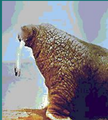
Морско й слон