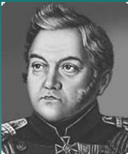
М. П. Лазарев.